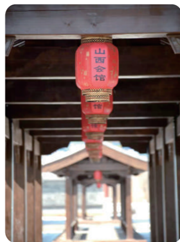
多伦山西会馆外景。

这些从内地引进的各种经营模式,与当地原有的贸易方式互为补充、取长补短,使得旅蒙晋商在多伦诺尔创造了一段商业发展史上的奇迹。