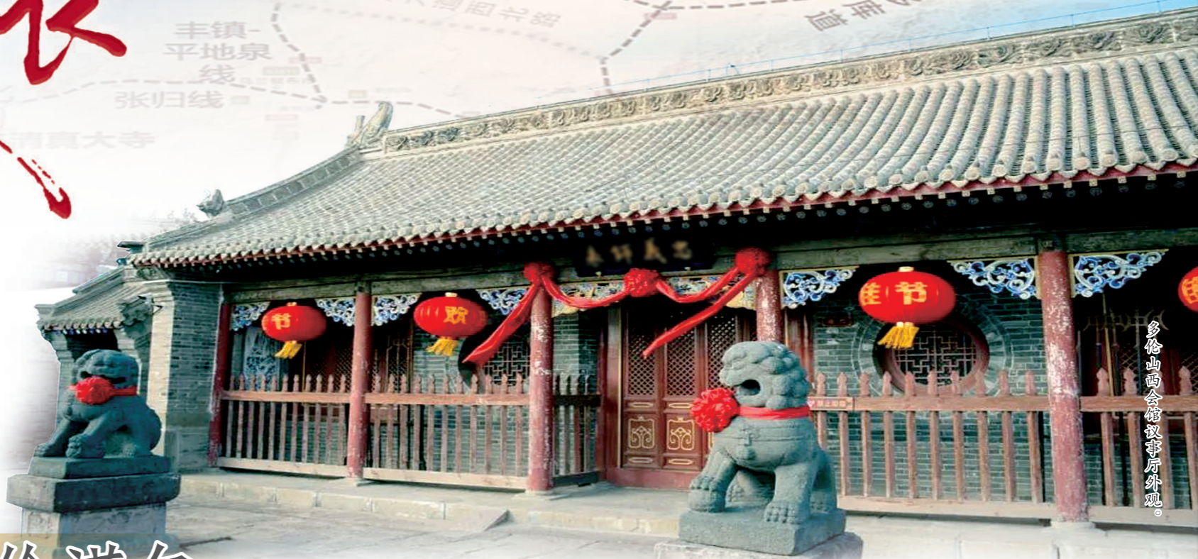
多伦山西会馆故事厅外观。

以山西会馆等为代表的清代古建筑群,见证了“万里茶道”的兴衰,成为国内重要历史文化遗产,多伦目前共有12处国家级文物保护单位。