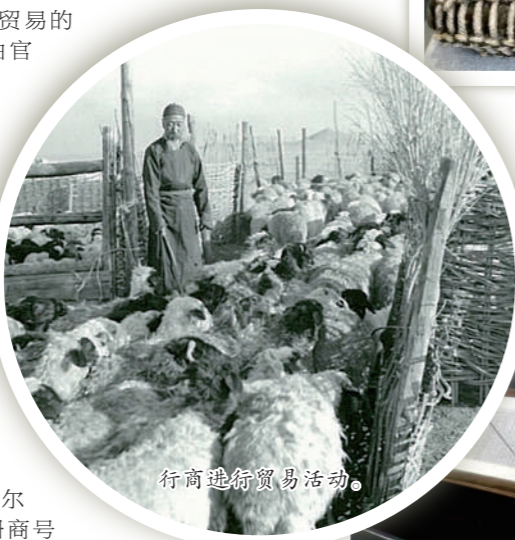
行商进行贸易活动。

到19世纪中叶,多伦诺尔达到了历史的全盛期,注册商号4000余家,形成了“东西宽四里,南北长七里,分十八甲,十八条街道”的繁华肆集,成为万里茶道上的重要商业贸易集散地。