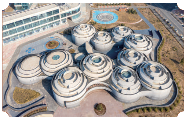
多伦诺尔博物馆俯瞰图。