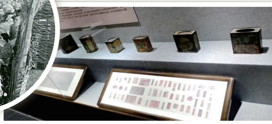
多伦“万里茶道多伦诺尔驿站”展厅展出的盛装茶叶的器具。