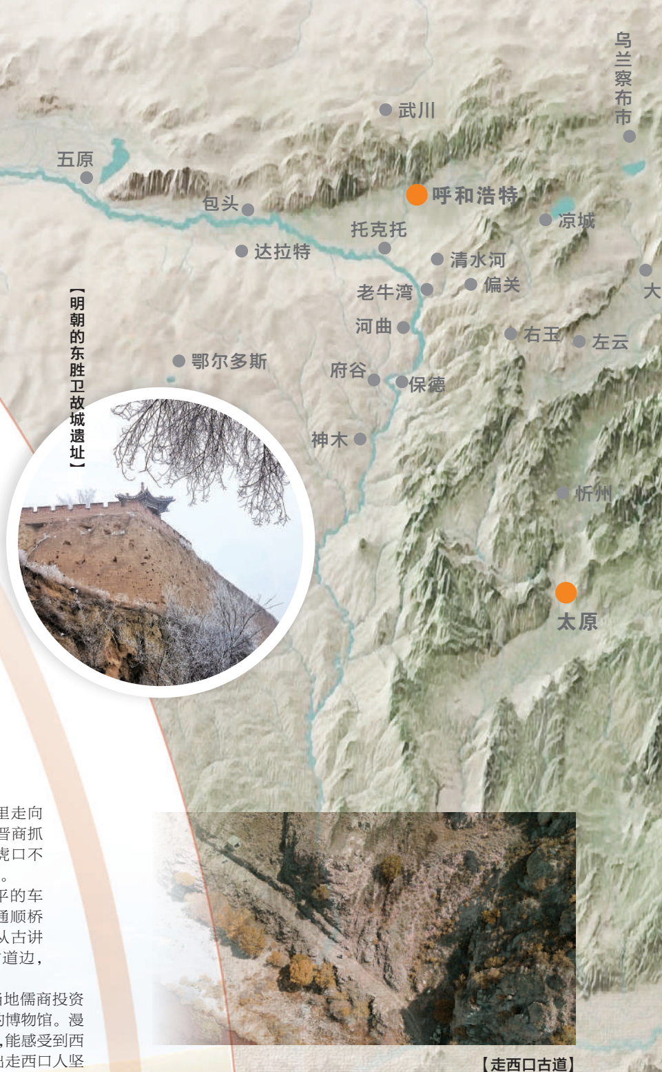
【明朝的东胜卫古城遗址】

右玉县特别珍视西口这段历史，当地儒商投资建起目前我国唯一一座以西口文化为背景的博物馆。漫步西口文化博物馆，从一件件历史文物中，能感受到西口文化蓬勃向上、生生不息的律动，体悟出走西口人坚韧不拔的精神风貌和开拓进取、勇往直前的不懈追求。