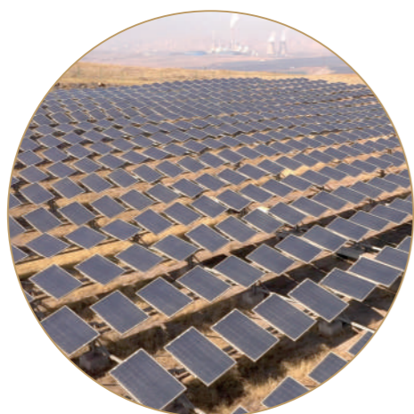
光伏发电已成规模。

招商引资火热起步、营商环境持续优化、企业开足马力生产、生态环境稳步向好……新春伊始,一幅“开年就大干、开局就加速、起步就起势”的火热景象在乌海市海南区精彩上演。站在新一年的起点上,为答好全面贯彻落实党的二十大精神开局之年高质量发展答卷,海南区将坚决端正发展观念,聚焦完成习近平总书记交给内蒙古的五大任务,准确把握“六个统筹”,做到“七个摒弃”,深化“七种意识”,在稳中求进的基础上稳中快进、稳中优进,以实干苦干、担当作为的工作状态奋力吹响实现“开门稳”“开门红”的前进号角。