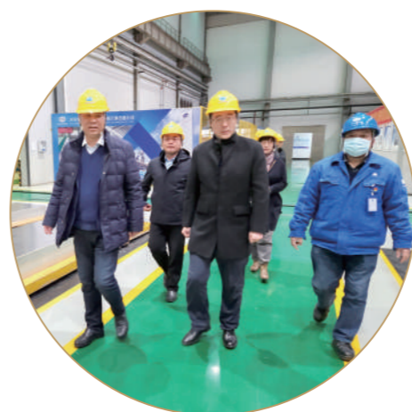
赴浙江省开展招商引资考察。