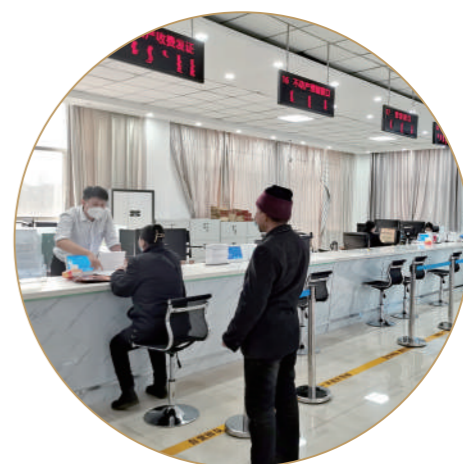
为企业群众提供优质政务服务。