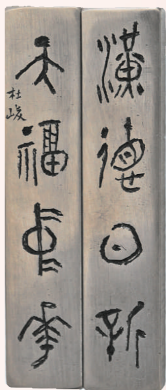
杜峻西周金文刻铜镇纸。