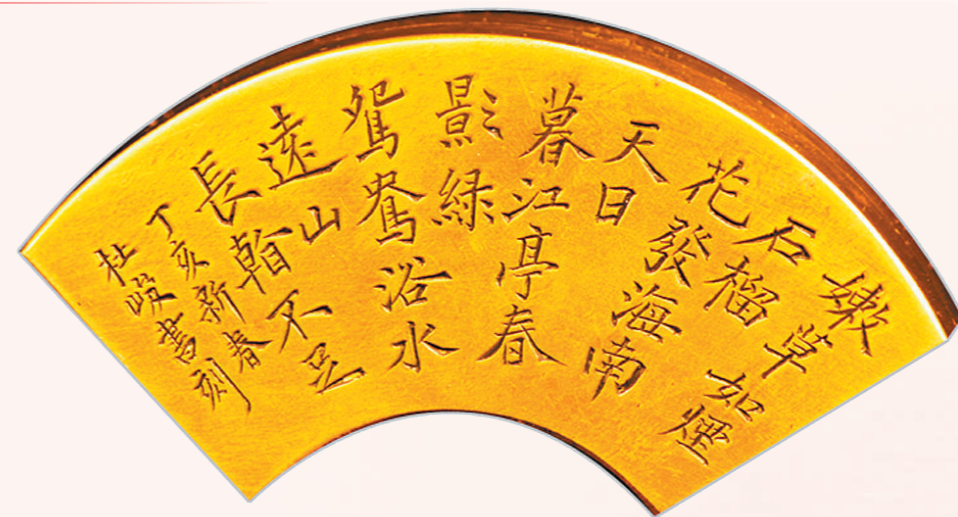
杜峻楷书刻扇形铜墨盒。