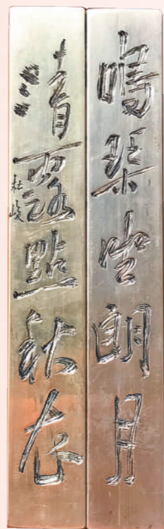
杜峻行书刻铜镇纸。

“拿印章来说，它的字体是篆书里面专用的，统称印篆，但是，其中又分汉印、秦印、唐宋九叠篆官印、元代花押印等，这些字体都不一样，分得特别细，如果刻铜者不懂，只是照猫画虎把形状刻出来，就