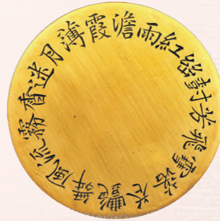
杜峻楷书刻圆形铜镇纸回环诗。