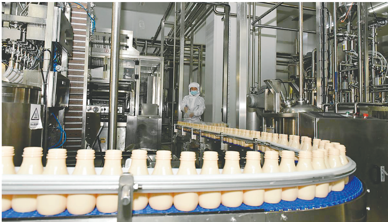
兰格格乳业有限公司生产线。

春和景明,乌兰察布大地处处是快马加鞭、你追我赶的繁忙生产景象。 在阴山优麦食品有限公司,2条生产线满负荷运行,订单生产已排到了3月底。今年,伴随着全国消费市场复苏,加之春节消费旺季,该公司新推出的“5红、5黑等5系列复合养生燕麦”再度抢到了市场先机,燕麦销售率先实现“开门红”;在内蒙古兰格格乳业有限公司,14条生产线全部开足马力,日产量300吨,生产的兰格格草原、雪原蒙古族酸奶系列产品畅销大江南北;京蒙协作企业内蒙古善都凯达食品有限公司产销两旺,订单生产排到了6月份,开发、生产的VF马铃薯、法式薯条占据国内领先地位。 这一个个火热的生产场景,是乌兰察布市现代农牧业高质量发展的生动写照。 近年来,乌兰察布市厚积薄发,强龙头、补链条、兴业态,打造“原味乌兰察布”农产品区域公用品牌,围绕“麦菜薯、牛羊乳”六大优势产业,深入实施六大行动,以“绿色”抢占市场,已初见成效。