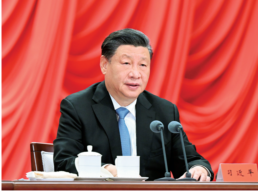
3月1日,中共中央党校建校90周年庆祝大会暨2023年春季学期开学典礼在北京举行。中共中央总书记、国家主席、中央军委主席习近平出席并发表重要讲话。

新华社北京3月1日电 中共中央党校3月1日举行建校90周年庆祝大会暨2023年春季学期开学典礼。中共中央总书记、国家主席、中央军委主席习近平出席并发表重要讲话。他强调,党校始终不变的初心就是为党育才、为党献策。各级党校要坚守这个初心,锐意进取、奋发有为,为全面建设社会主义现代化国家、全面推进中华民族伟大复兴作出新的贡献。