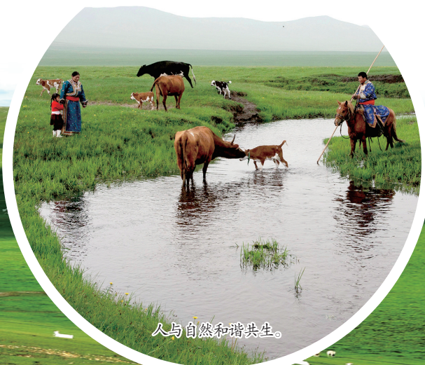
人与自然和谐共生。