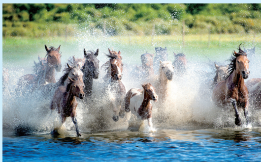
美丽的锡林郭勒草原。

近十年,锡林郭勒盟深入贯彻落实习近平生态文明思想,始终将生态保护建设放在突出位置,坚持以自然修复为主,编制实施全盟国土空间生态修复规划,全力抓好草原生态修复、沙地综合治理、水系湿地保护等国家确定的重点工程和国土绿化行动,构建全域生态安全格局,生态环境总体退化恶化趋势得到遏制,创建成功国家生态文明建设示范盟,切实筑牢我国北方重要生态安全屏障,这是锡林郭勒盟肩负的重大政治责任,也是践行“绿水青山就是金山银山”理念的实际行动。