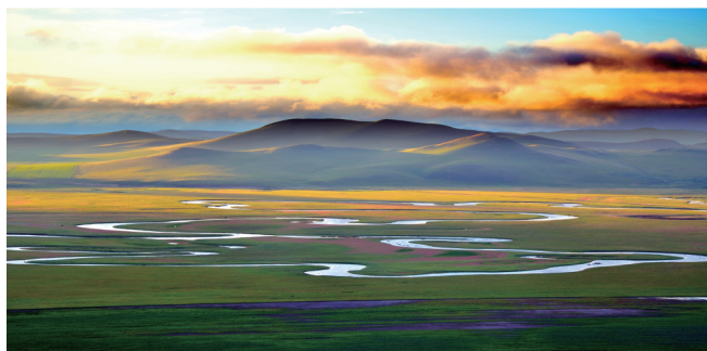
锡林河九曲湾草原原景。