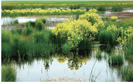
乌拉盖管理区贺斯格淖尔湿地。