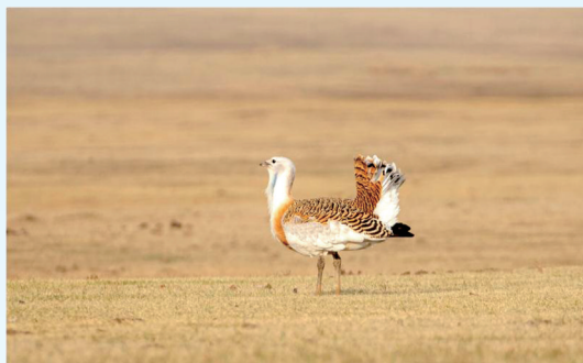
珍贵禽类的栖息地。