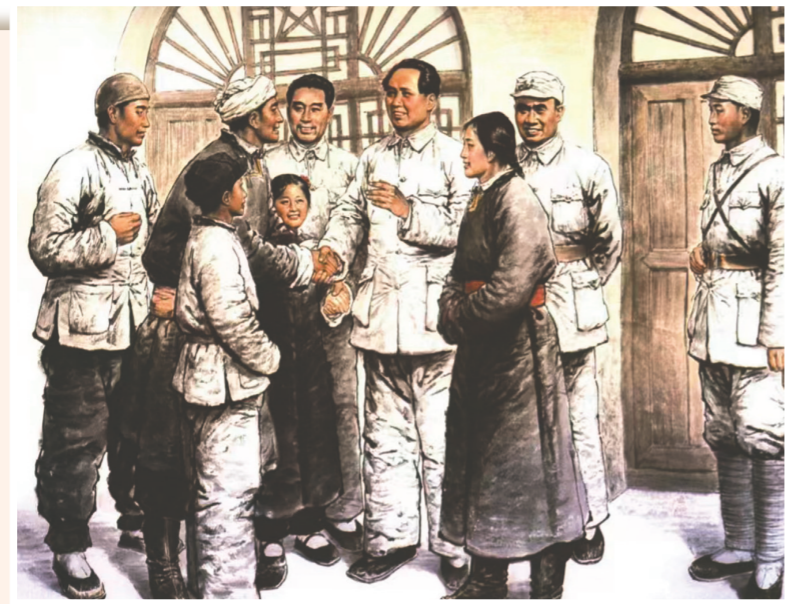
中国画《心向延安》孟喜元

“历史川流不息，精神代代相传”。内蒙古自治区成立70余年来，革命历史题材一直吸引着广大美术家的创作热情，出现了许多在主题表达、精神传递、情境叙事和艺术表现方面都比较优秀的作品。今天，我们回望内蒙古的革命历史题材美术创作，更能深刻理解其历史内涵与时代意义。