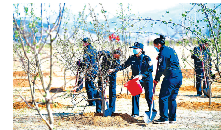
开展义务植树活动。