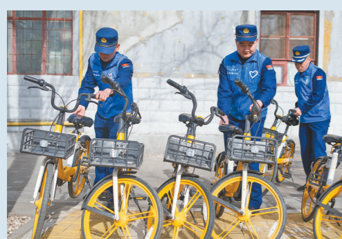
规范共享单车的摆放。

近日,呼和浩特市赛罕区山丹街消防救援站被中宣部命名为“第八批全国学雷锋活动示范点”。