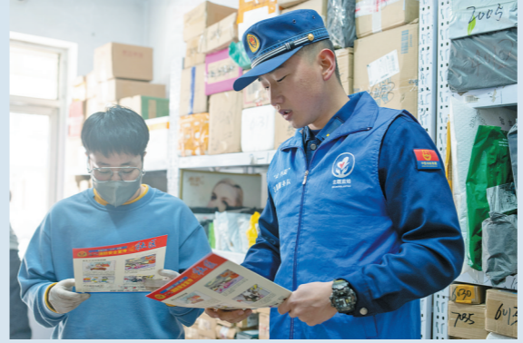
进行消防安全知识宣传。

“北疆蓝焰”山丹蓝雷锋志愿服务队已吸纳志愿者1040人,队员累计服务时长近4万小时,志愿者们自发组建了“雷锋基金”,已累计捐款13869元。共向群众发放各类消防知识宣传手册2万余份、文明城市创建指导手册1.5万余册、消防文创物品3000余份。