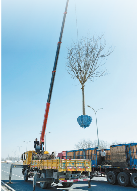
苗木补植,绿化城市。