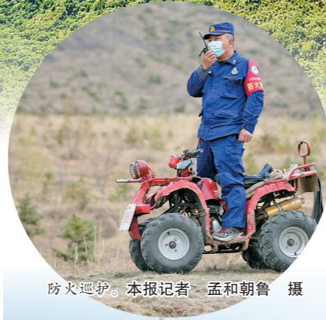
防火巡逻。

每一抹绿色,需要你我共同努力守护。春天里,让我们奔赴一场“绿色之约”,保护森林资源,共建绿色家园。