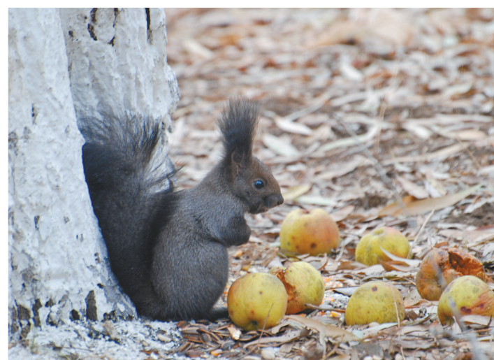
喜不自胜 开鲁县白塔公园,一只松鼠面对投喂的苹果,喜不自胜。