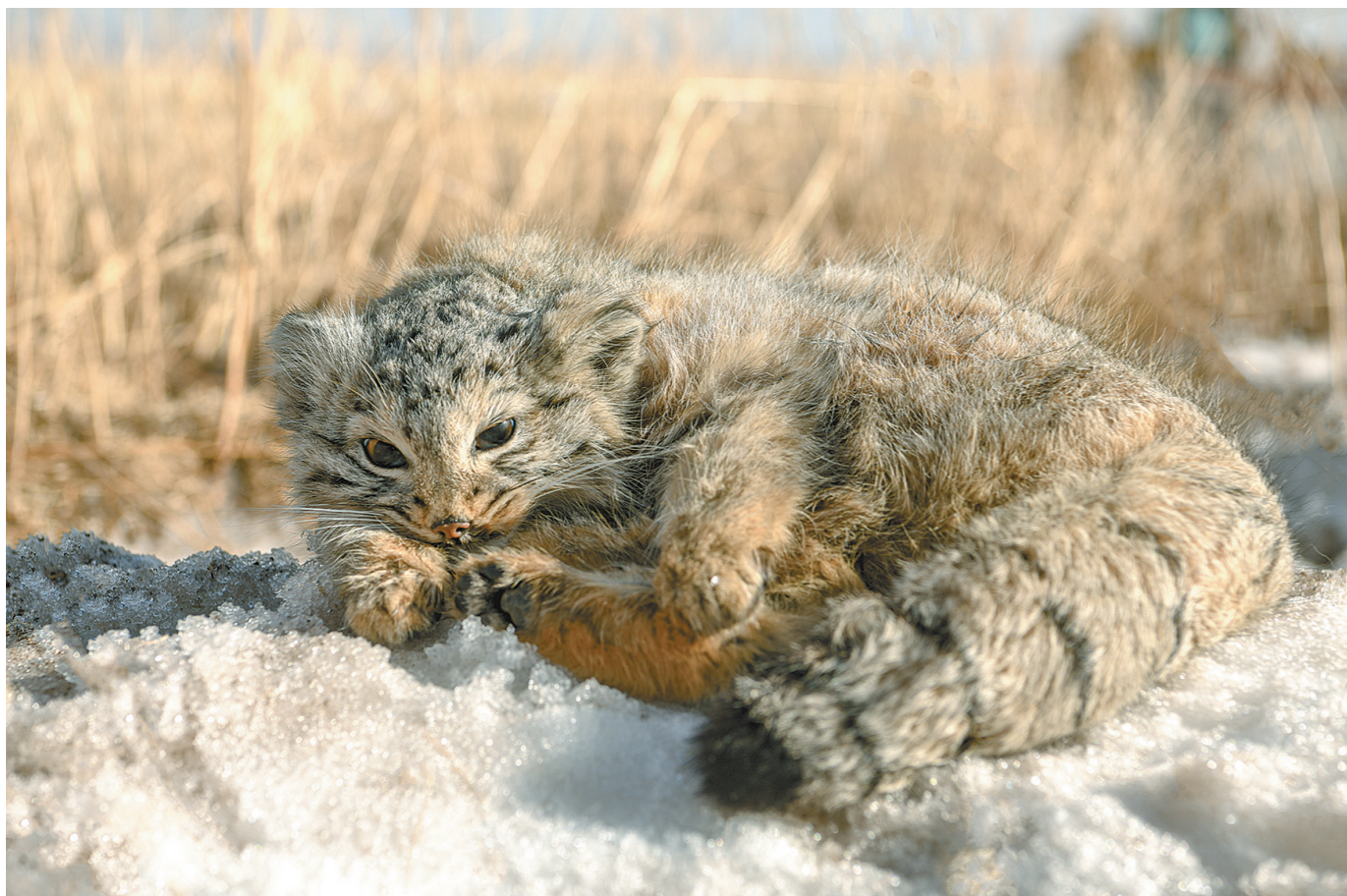
卧雪当席 锡林郭勒草原,一只兔狲在雪地上小憩。