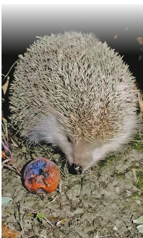
昼伏夜出 呼和浩特市金桥开发区,一只刺猬夜间觅食。