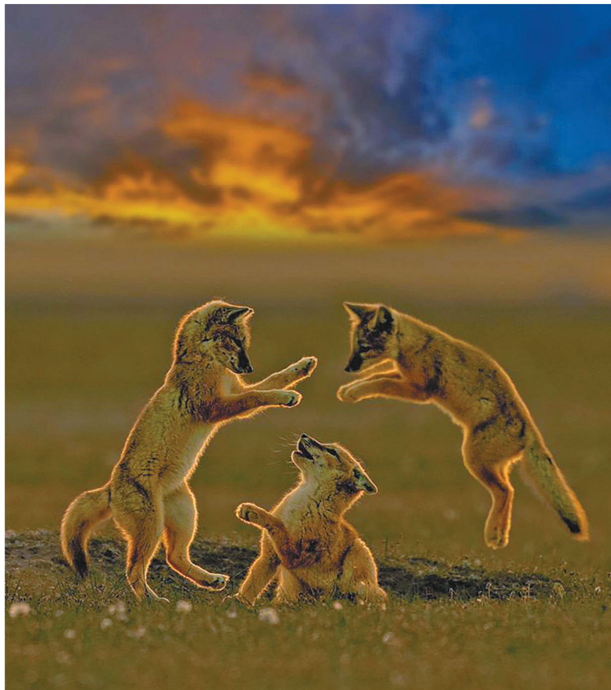
乐而忘返 鄂温克族自治旗辉河国家级自然保护区,一窝沙狐在草地嬉戏,夕阳西下,乐而忘返。