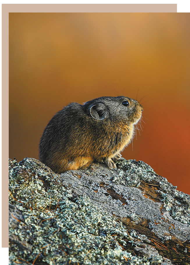
怡然自得 阿尔山石兔。