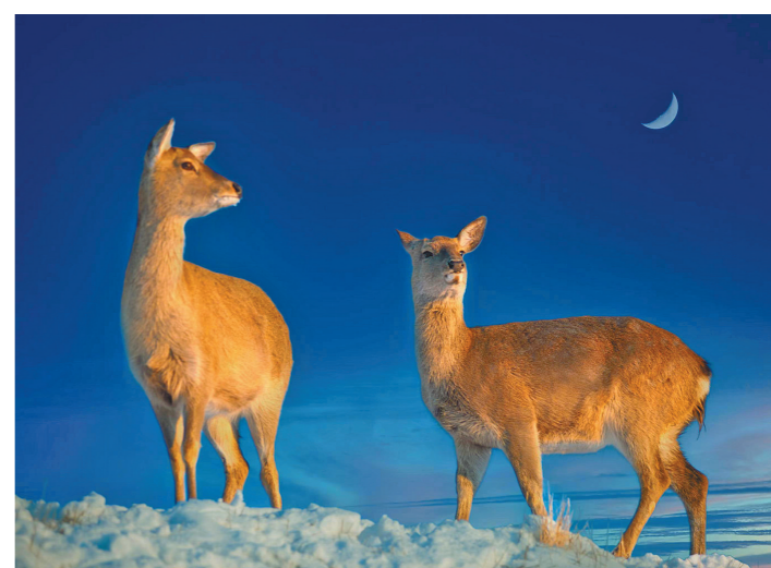
月下回首 根河市德尔布尔镇,两只梅花鹿在月下觅食。