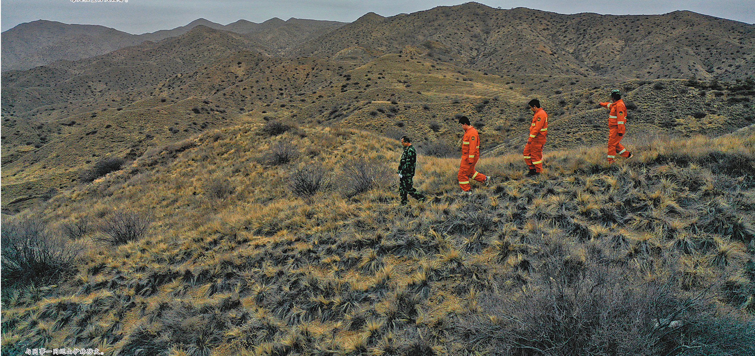
与同事一同巡山护林防火。