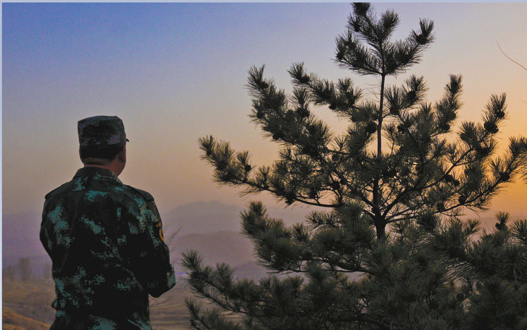
深情守望青山绿树。