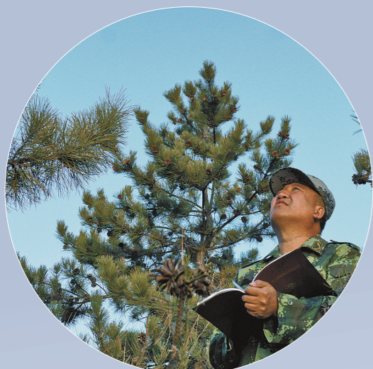
记录树木生长和病虫害情况。