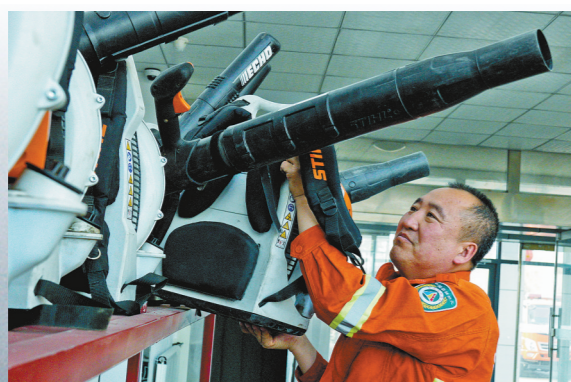
每天检查防火设备。