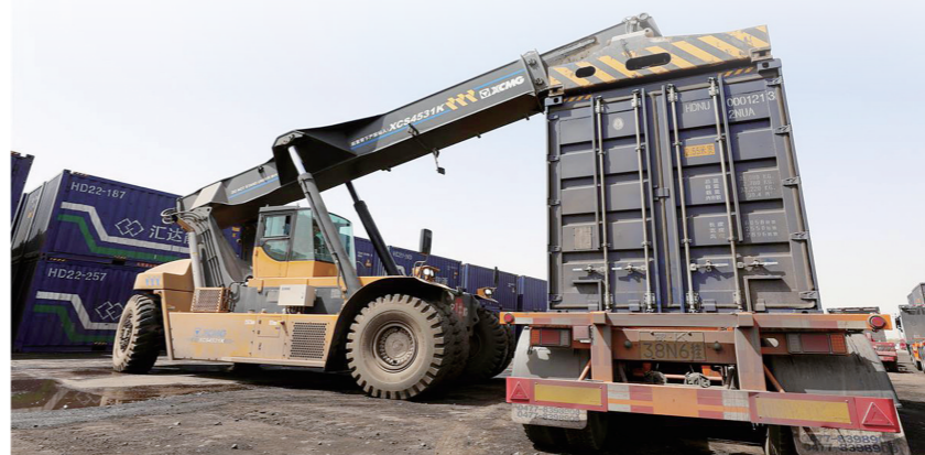
西部陆港“散改集+新能源”项目智慧吊箱现场。

“裴队长,我们能坐你的车吗?”“没问题,上来吧!”终于见到了“它”的真面目:整齐的车辆启动,靠近陆港时只见大门