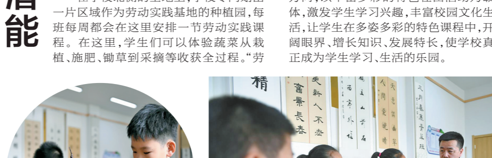
认真学习老师讲解书写技巧。