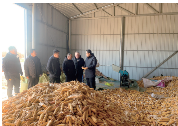
挂职团队实地考察苏尼特右旗朱日和镇巴彦教日格勒嘎查高产饲料基地。