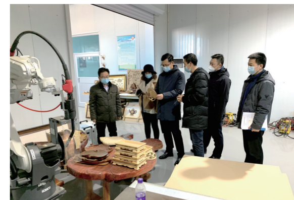
挂职团队调研苏尼特右旗综合高级中学职业教育。