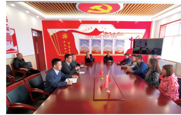
挂职团队与支教老师座谈。

苏木镇。他们深入基层访农户、看产业、问需求、听建议,在草原情、泥土味儿、乡村风渐浓的调研了解中,在如数家珍的第一手资料里,完成了“挂职”到“挂心”的知行合一。 苏尼特右旗是牧业大旗,为了便于工作开展,破解语言难题,挂职团队积极向当地干部“求学”,并将其当成沟通“联络员”,一边摸底调研一边与当地干部群众谋划帮扶项目,嘎查队部、牧场农户、蔬菜大棚、牛舍羊圈,京蒙帮扶的资金落在哪里,哪里就有他们的身影,迅速实现了从“新手”到“行家”的角色转变。