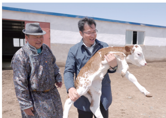
挂职干部在苏尼特右旗赛罕乌力吉苏木额尔敦嘎查良种牛养殖基地调研牛接出栏情况。