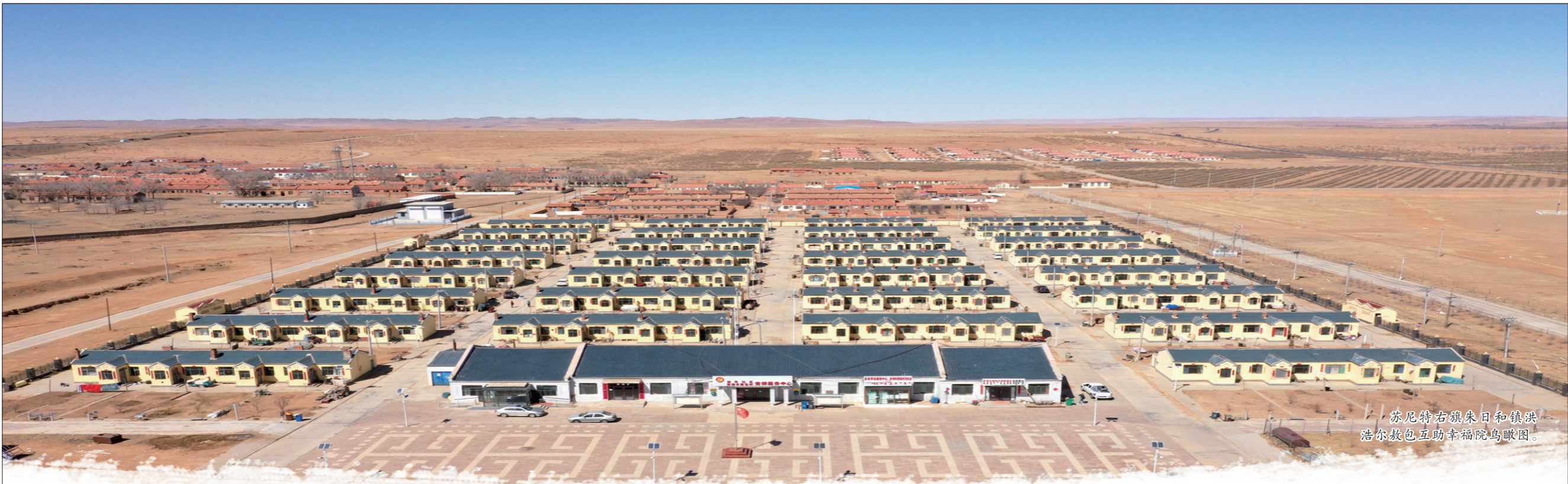
苏尼特右旗朱日和镇洪浩尔教包互助幸福院鸟瞰图。