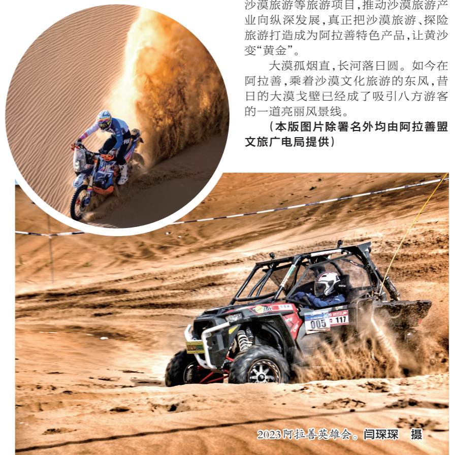
2023阿拉善英雄会。

为打好“苍天般的阿拉善”这张极高知名度和美誉度的牌,该盟以5A级景区为龙头,带动全盟高A级景区提质升级,组织居延海景区申报国家4A级景区;阿右旗曼德拉山岩画旅游区、九湖源景区、额济纳博物馆申报国家3A级景区;胡杨林、居延海、黑城遗址、定远营、通湖草原、南寺6个景区入选“内蒙古网红打卡地”;今年4月,该盟在第二届全国自驾俱乐部大会“自驾游中国——最受欢迎系列奖项”中斩获3项全国荣誉,分别是“自驾游中国——最受欢迎全国自驾游目的地”“自驾游中国——最受欢迎全国自驾游精品线路”(两条:阿拉善自驾环游活动和胡杨林);同时,该盟还大力发展乡村旅游助力乡村振兴,阿左旗希尼套海嘎查、阿右旗巴丹吉林嘎查入选首批自治区级乡村旅游重点村名单,其中巴丹吉林嘎查入选第三批全国乡村旅游重点村推荐名单。现如今,巴彦浩特镇、巴丹吉林镇、达来呼布镇等特色旅游小镇遍地开花,已成为该盟全域旅游的一张亮丽名片。