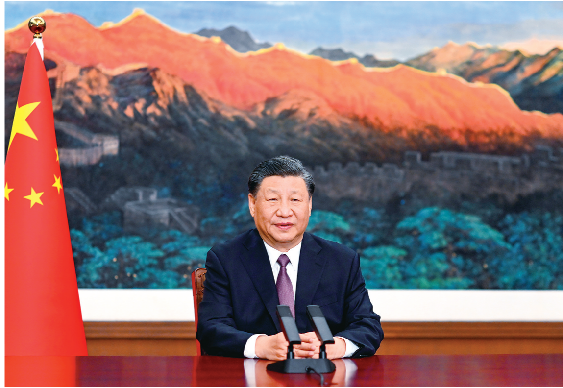
五月二十四日,国家主席习近平应邀以视频方式出席欧亚经济联盟第二届欧亚经济论坛全会开幕式并致辞。