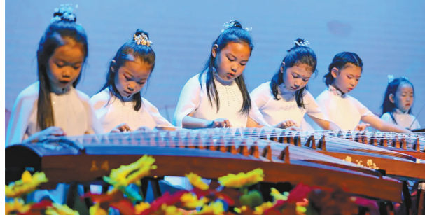
古筝演奏《听我说谢谢你》。