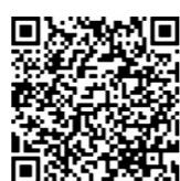
扫描二维码关注相关报道