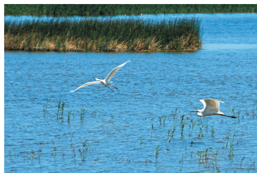
鸟儿在乌梁素海自由翱翔。