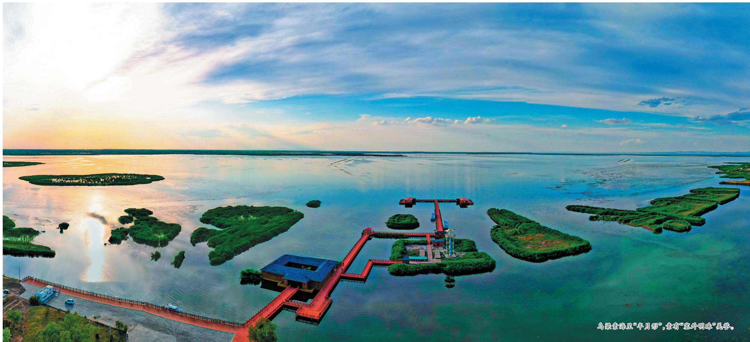
乌梁素海呈“半月形”，素有“塞外明珠”美誉。