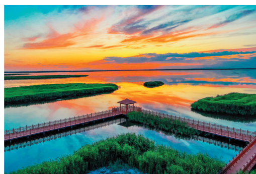
晚霞映衬下的乌梁素海美不胜收。

乌梁素海，蒙古语意为生长红柳的地方，是黄河改道形成的河迹湖，也是全球荒漠半荒漠地区极为少见的大型草原湖泊，目前湖区总面积293平方公里。乌梁素海是候鸟的天堂，目前有鸟类260多种，600多万只在此栖息繁衍。在乌梁素海西部是浩瀚的乌兰布和沙漠，南部是奔流的黄河，东部是葱郁的乌拉山国家森林公园，北部是连绵的阴山山脉和辽阔的乌拉特草原，中部是沃野千里的河套平原，这些组成了一个山水林田湖草沙共融共生的生命共同体。