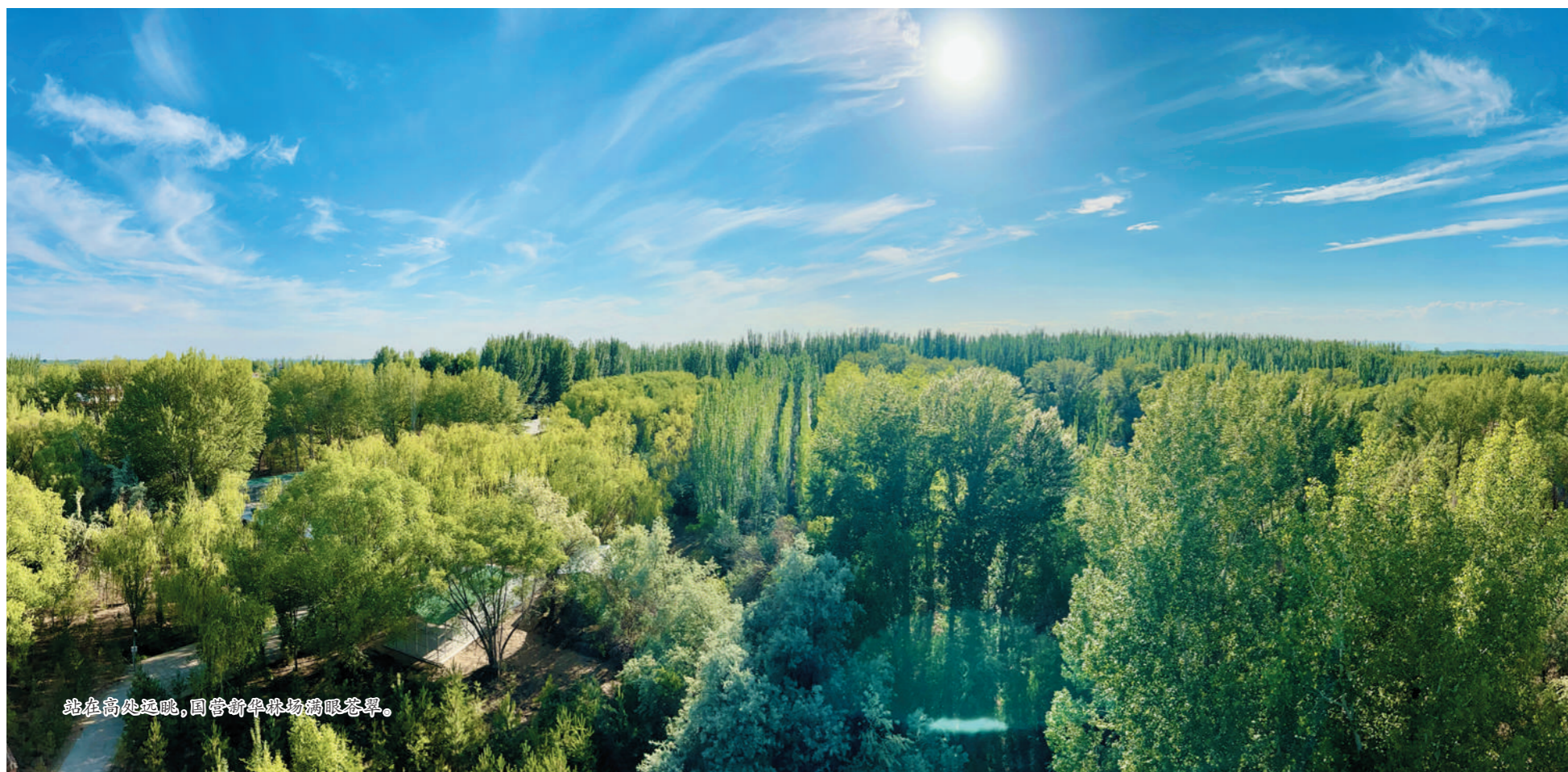
站在高处远眺，国营新华林场满眼苍翠。