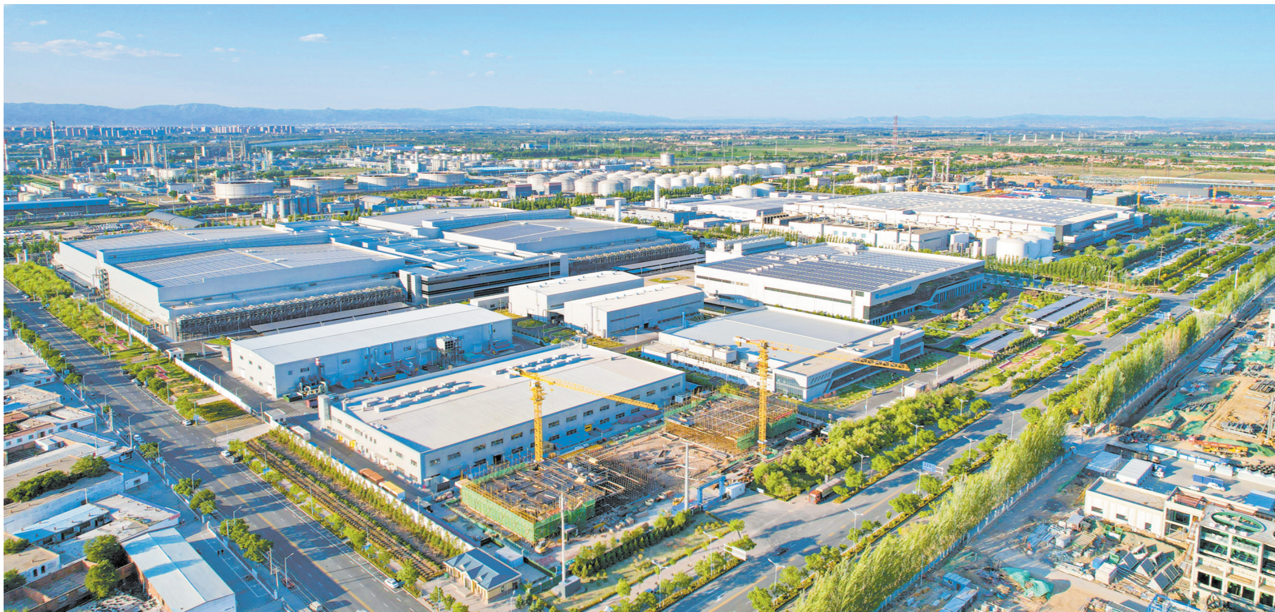
航拍镜头下的中环产业园。