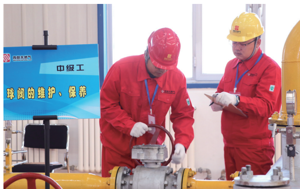
内蒙古西部天然气管道运行有限责任公司举办输气工“学技术、强技能、提管理、保安全”主题技术比武大赛。