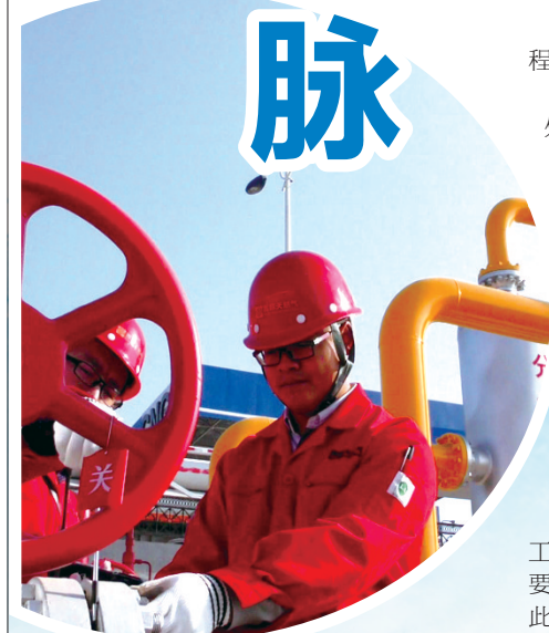
输气工在工艺区进行阀门维护保养。