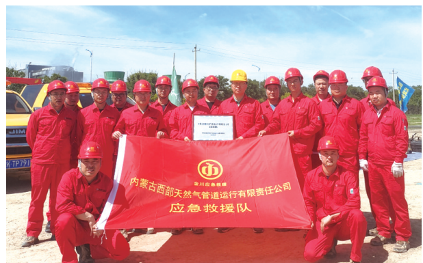
2021年6月,维抢修中心被呼和浩特经济技术开发区金川工业园区管委会列入园区第一家应急救援队伍。

在公司展柜里,自治区安康杯竞赛“优胜单位”、自治区“五一劳动奖状”、全国“青年安全示范岗”、全国“五一劳动奖状”……一张张奖状见证了“红色铁军”寒冬酷暑的现场巡查,彰显着企业多年积累的丰富的生产运行管理经验,是企业践行安全生产使命和担当的有力证明。