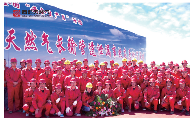
全国“安全生产月”期间,内蒙古西部天然气管道运行有限责任公司组织长输管道泄漏事故应急处置演练。