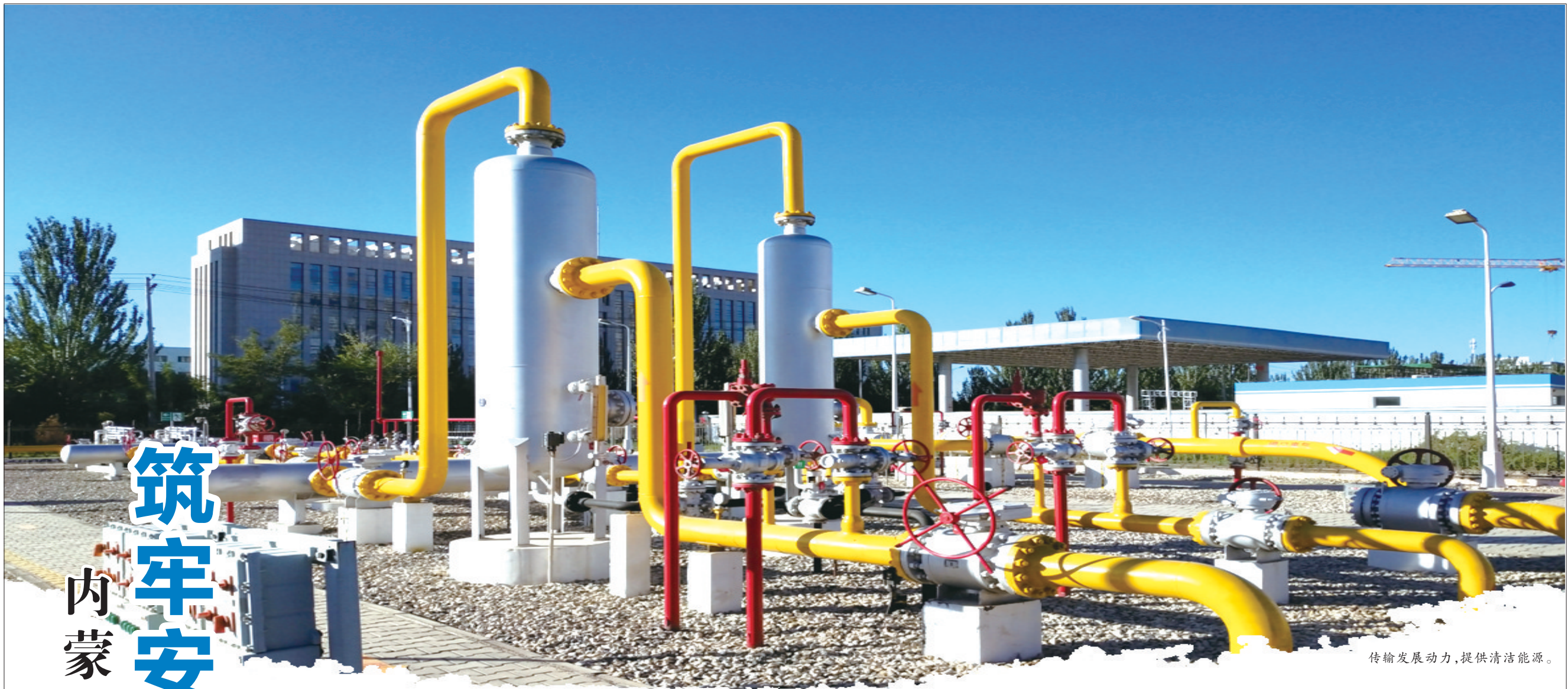
传输发展动力,提供清洁能源。