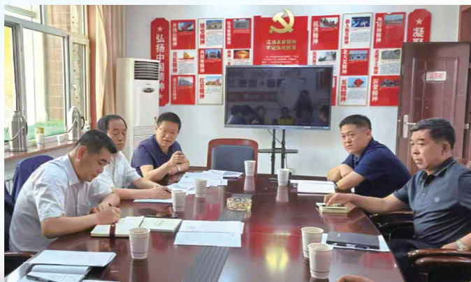
线货运增量调研座谈。