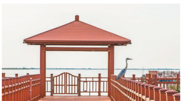
乌梁素海候鸟种类、数量不断增加。