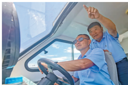
在湖面上进行巡查。