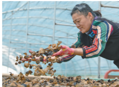
种植业。渔民上岸后,从事特色