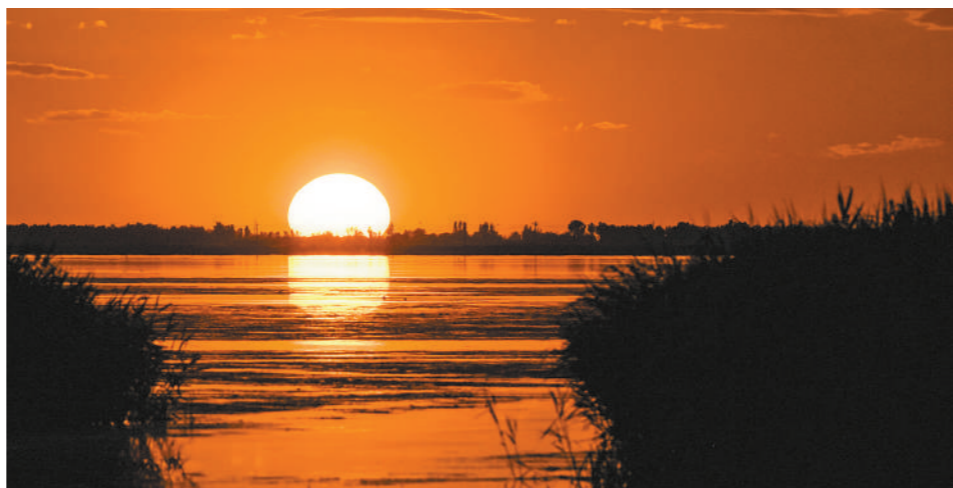
乌梁素海落日美景。