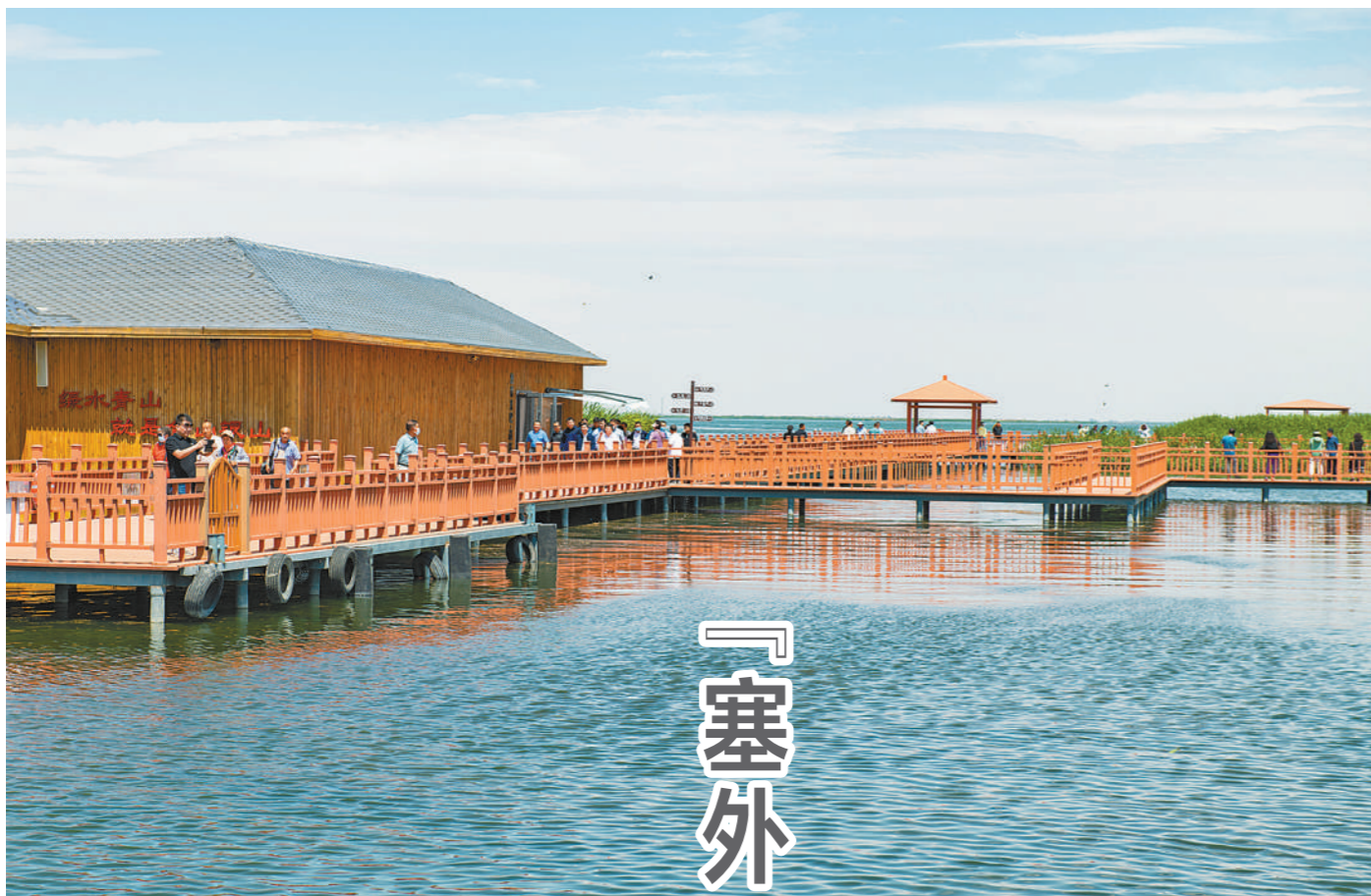
乌梁素海游人如织。