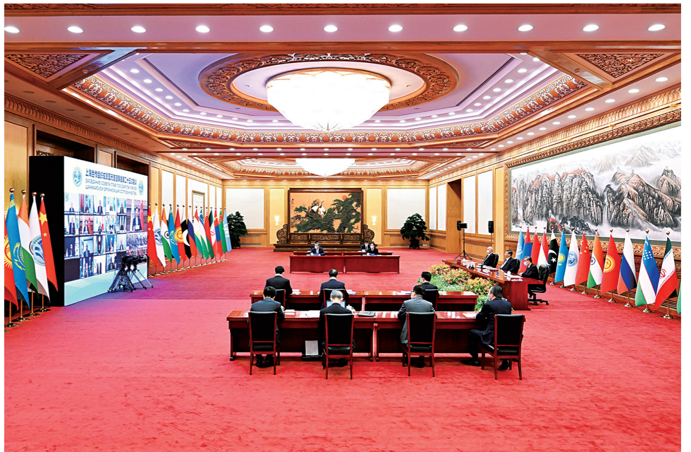
7月4日下午,国家主席习近平在北京以视频方式出席上海合作组织成员国元首理事会第二十三次会议并发表题为《牢记初心使命 坚持团结协作 实现更大发展》的重要讲话。