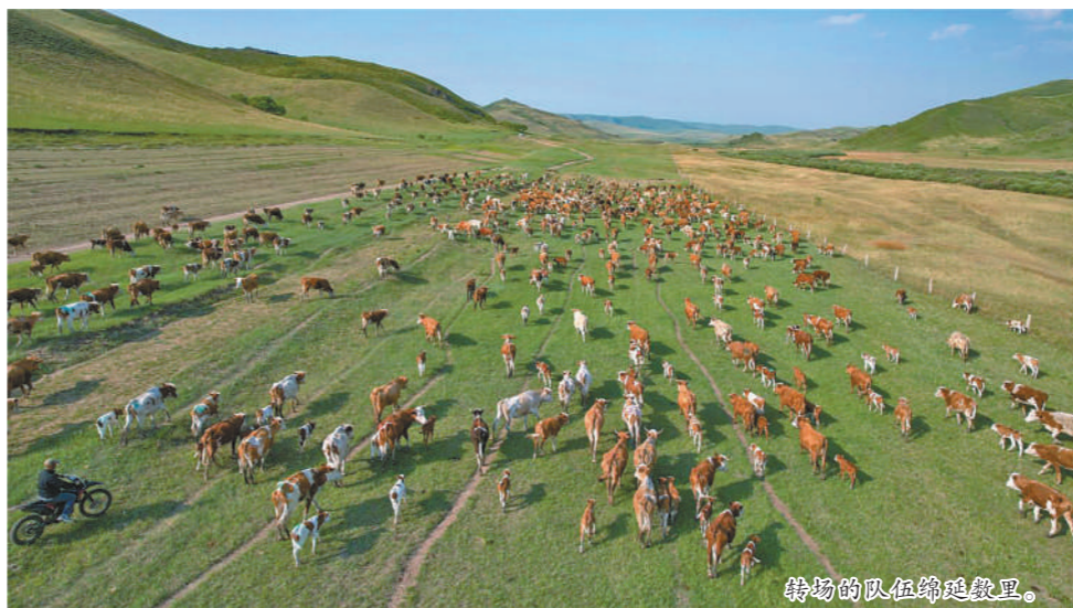
转场的队伍绵延数里。

为了提升生态系统的多样性,保障水草资源的可持续利用,近年来,扎鲁特旗将草原禁牧、草畜平衡与牧民增收、生态保护相结合,促进草原休养生息,提升生态修复与保护成效。同时,扎鲁特旗加强政策协调,完善夏营地基础设施和配套设施建设,并在转场沿途做好相关服务保障工作,为牧民和牲畜安全顺利转场保驾护航。