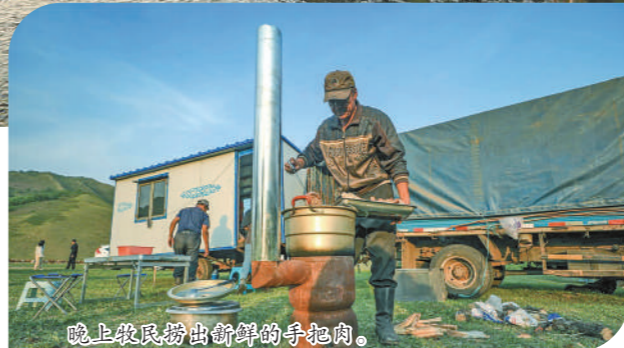
晚上牧民捞出新鲜的手起肉。

盛夏的扎鲁特大草原一碧千里,风景如画。近日,扎鲁特旗格日朝鲁苏木16个嘎查的500多头牧民以嘎查或小组为单位,分批赶着5万多头牛,跋涉100多公里,转场到水草丰茂的夏季牧场“安营扎寨”,开始4个多月的夏营地生活。