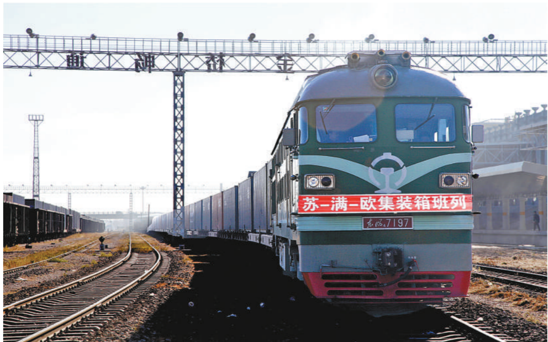
中欧班列(苏满欧)在满洲里铁路口岸首发出境。

加大就业服务扶持力度——强化政府购买就业公共服务,重点支持高校毕业生等青年就业创业;提升劳动者职业技能素质,帮助农民工、脱贫人口等重点群体就业,依托用工企业、职业院校、技能学校等,持续开展岗前培训、职业技能提升培训;加强劳动者权益保障,通过政府购买服务提供劳动人事争议调解、集体协商指导等服