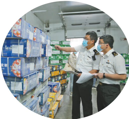
海关关员在食品外贸企业对比信息。

今年以来,内蒙古充分发挥处于中蒙俄经济走廊及“一带一路”重要节点的区位优势,大力提升公路、铁路运输效能,积极拓展并采用航空货运、TIR(建立在联合国公约基础上的全球性海关便利通关系统)等新的跨境运输、跨境通关方式,打造全方位立体式跨境物流大通道,为高水平对外开放和外贸高质量发展蓄势助力。