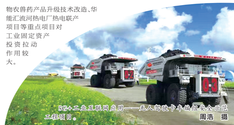
5G+工业互联网应用——无人驾驶卡车编组安全示范工程现场。

物农兽药产品升级技术改造、华能汇流河热电厂热电联产项目等重点项目对工业固定资产投资拉动作用较大。