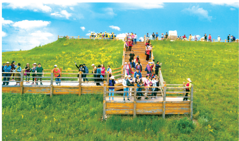
在享有“亚洲第一湿地”之称的国家4A级景区——额尔古纳湿地，来自天南地北的游客络绎不绝。

聚力增量提质，发挥优势推动农牧业加快发展。呼伦贝尔市以农牧业产业化、组织化、品牌化、融合化、绿色化、现代化为发展导向，聚焦重点产业、特色产业，在培育龙头、延伸链条、园区支撑等方面一体发力。“十四五”以来，共实施高标准农田276.92万亩，在自治区考核位列第一，羊草扩繁基地20万亩播种任务全部实施，播种面积位列全区第一，阿荣旗乳业产业园基地等项目加快建设，粮食播种面积完成