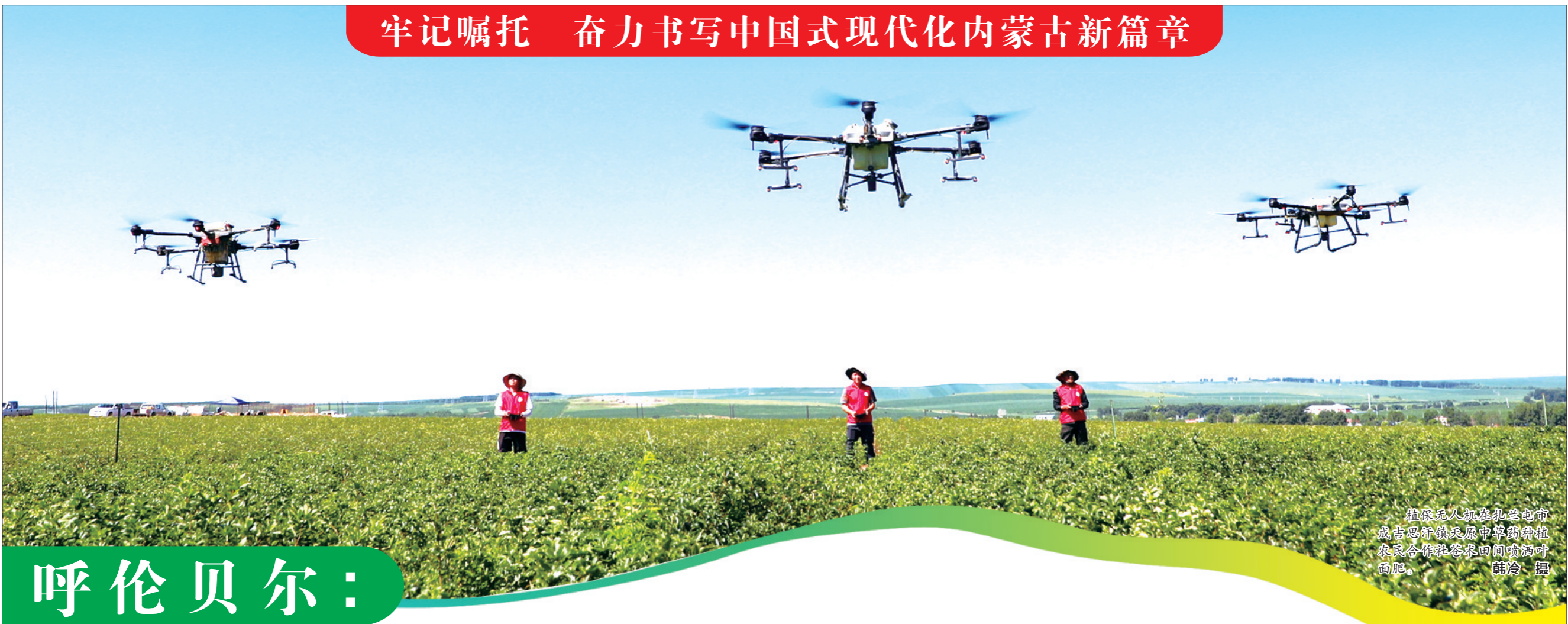
植保无人机在扎兰屯市 成吉思汗镇民原中草药种植 农民专业合作社田间嗡嗡叫 而飞。