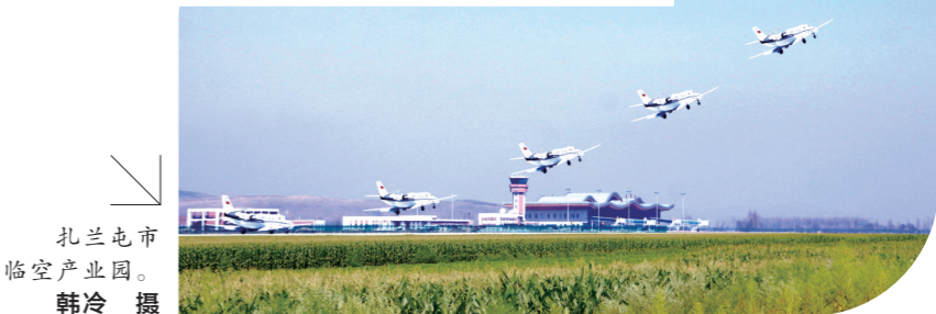
扎兰屯市 临空产业园。