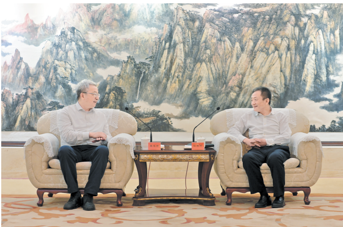
七月二十七日,自治区党委书记孙绍骋,自治区副主席王莉霞,自治区政协主席张延昆在呼和浩特拜会全国政协副主席王光谦。