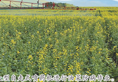
大型自走式喷灌机进行油菜防病作业。