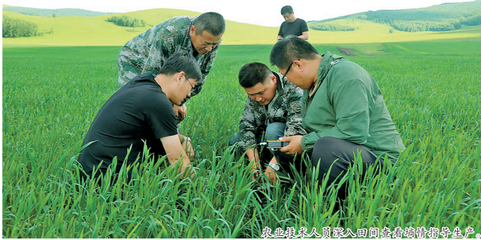
农业技术人员深入田间查看墒情指导生产。