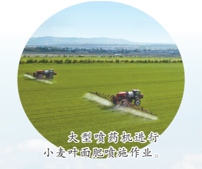
大型喷灌机进行小麦叶面肥喷施作业。