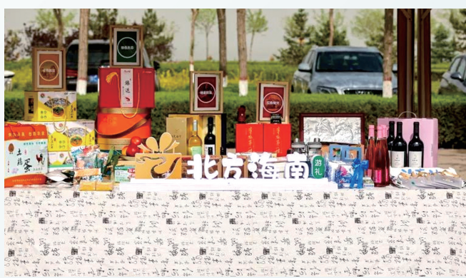
海南区的特色文旅产品。