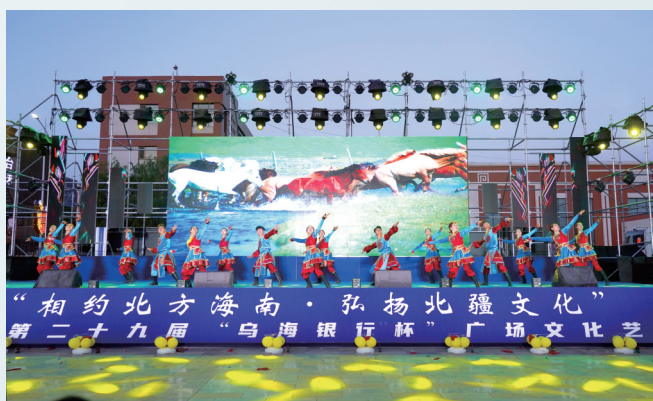
海南区第二十九届广场文化艺术节。