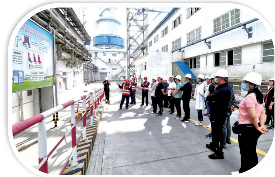
通辽市中青年干部在霍林郭勒市高新技术开发区调研铝行业烟气污染物超低排放示范工程。