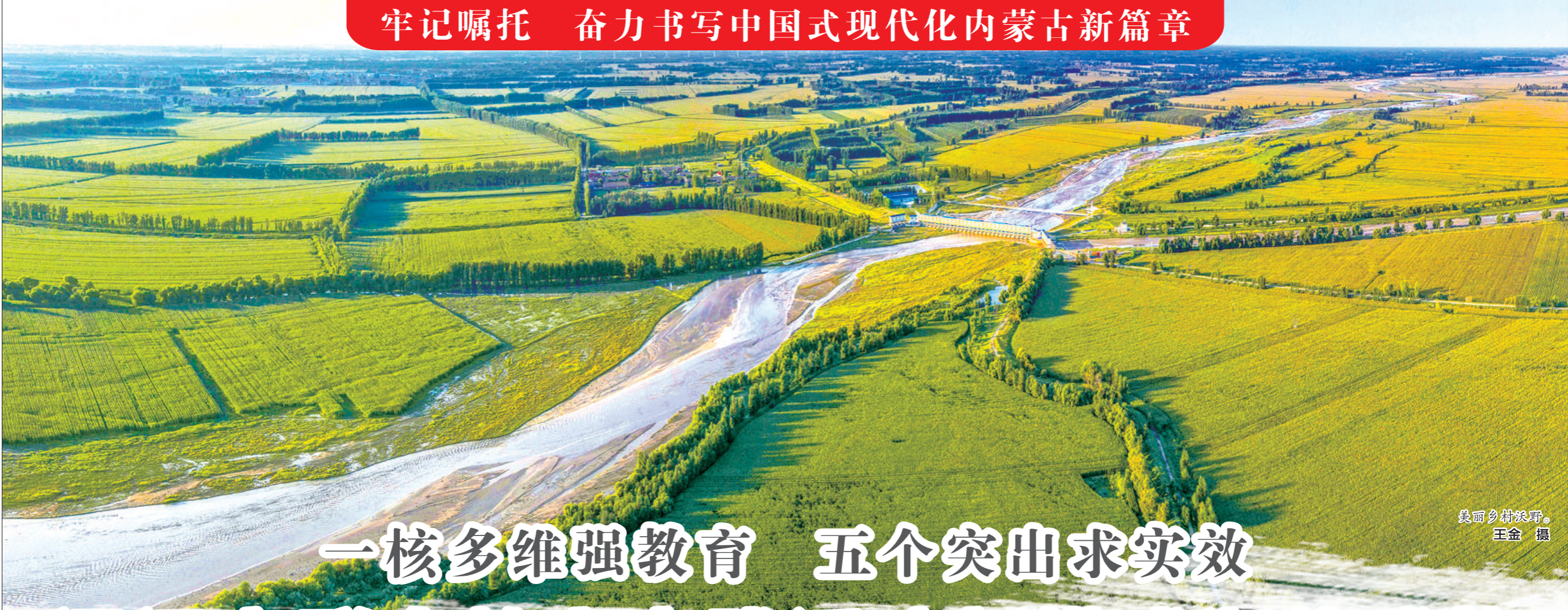
美丽乡村沃野。