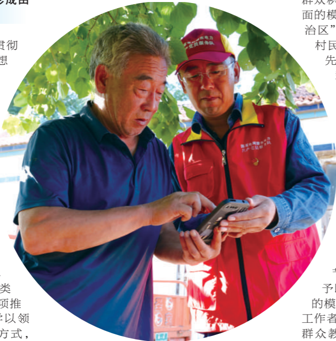
共产党员服务队成员上门指导群众用手机缴费。

群众积极争创各条战线、各个领域、各个方面的模范,以实际行动全方位建设“模范自治区”。在农村牧区,开展致富能手、最美村民、最美家庭、最美庭院、产业强户等先进典型评选实践活动,激励农牧民群众争当乡村振兴的模范。在城镇社区,开展“最佳小主人”“最受尊敬银发管家”“优秀志愿者”“最好社区居民”“最美家庭”5项评选,激励居民群众争当文明创建的模范。在机关单位,通过比学习争先进、比干劲争表率、比业绩争一流“三比三争”实践活动,激励全体干部争当担当作为的模范。在学校,以比品德、比学习、比风采“三比”为主要内容,分类设置评选最美教师、优秀团员、三好学生“三评”具体标准,利用教师节、国庆节等时间节点召开表彰大会予以表彰,激励全体师生争当强国强军的模范。在企业,以“先进集体”和“先进工作者”两个评比活动为抓手,大力选树在群众教育实践活动中表现突出的先进典型,激励企业员工争当爱岗敬业的模范。在新兴领域,通过开展“大晾晒、大比拼”活动,争当创新创业的模范。在民主党派,通过开展“同心同行”行动,争当团结奋斗的模范。