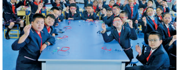
呼和浩特市苏虎街小学的学生们来到科技馆上科学课。