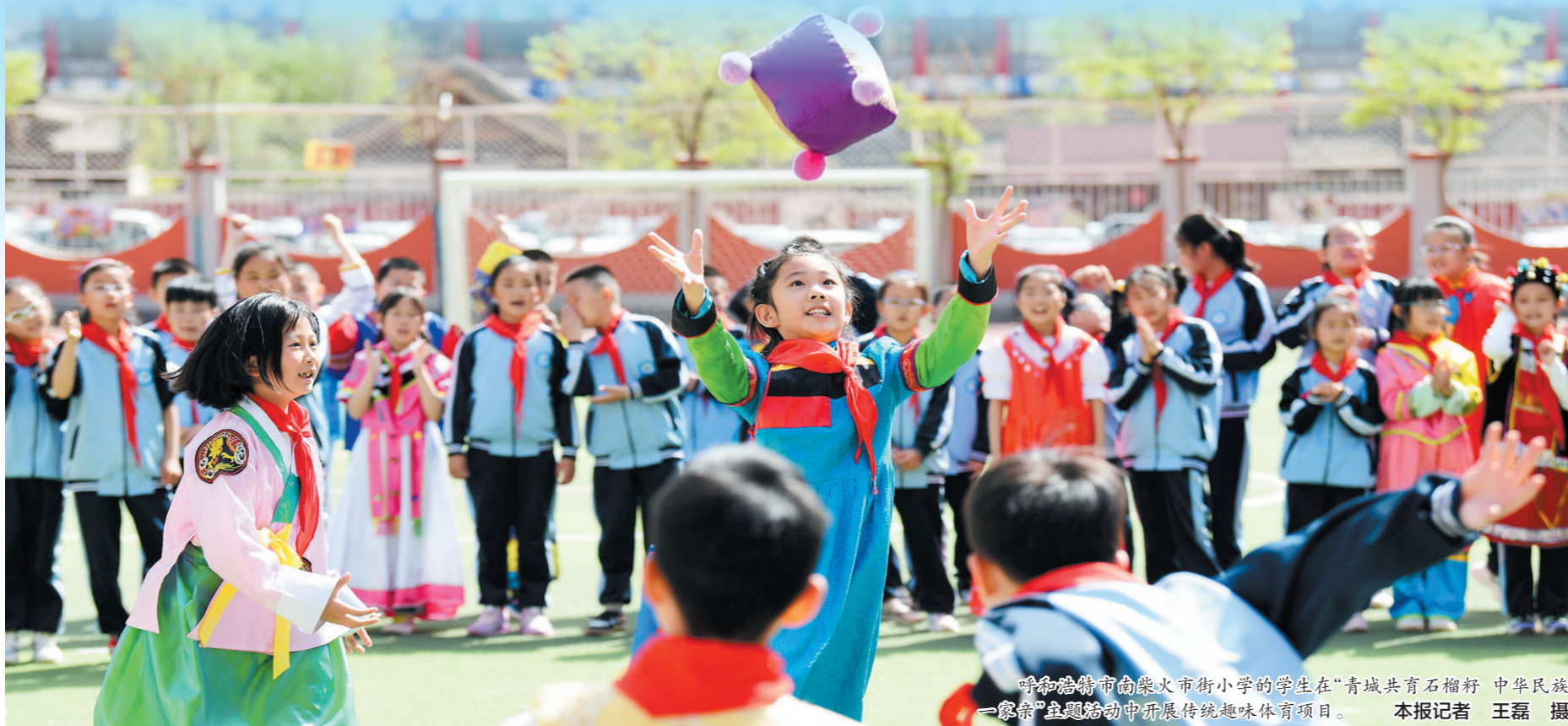
呼和浩特市南火街小学的学生在“青城共育石榴籽 中华民族一家亲”主题活动中开展传统趣味体育项目。