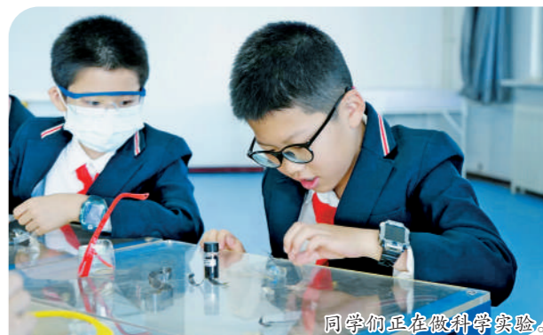
同学们正在做科学实验。