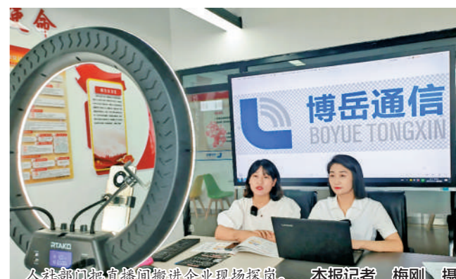
入企探岗直播探岗搬进企业现场探岗。

自治区就业服务中心相关负责人表示,全区各地将致力于线下招聘“不停歇”,线上招聘“不打烊”,积极打造“直播带岗、入企探岗”等招聘品牌,让更多求职者通过多元化招聘方式找到称心的工作,为更多企业在招才引才中汇聚发展活力,推进就业创业工作跑出“加速度”。