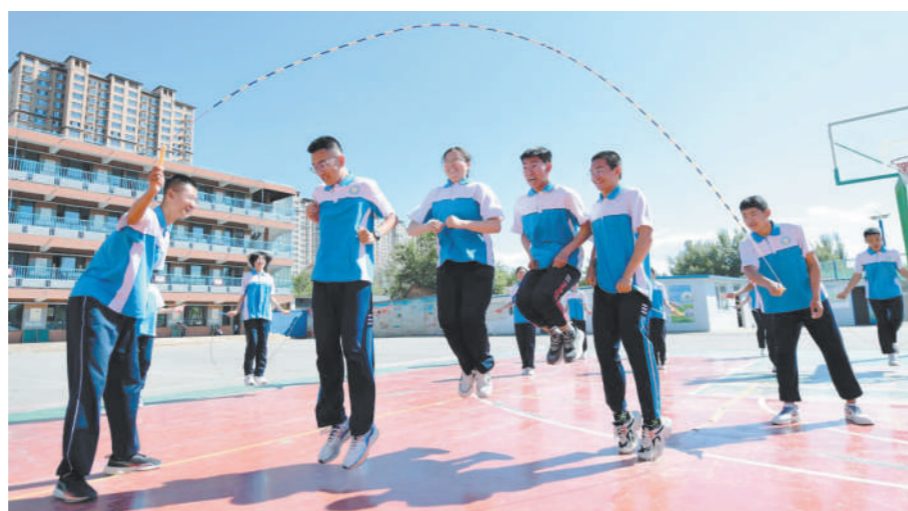
呼和浩特市第二十七中学学生在体育课上跳绳。