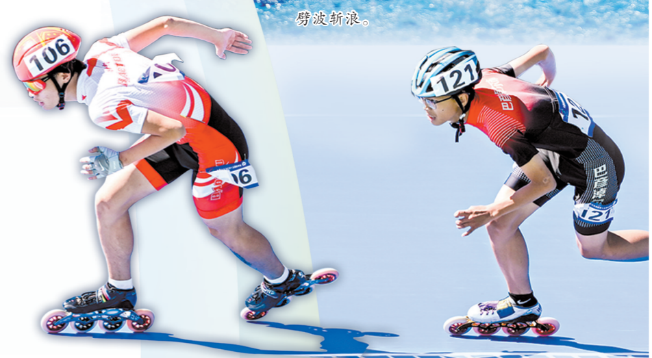
速度轮滑上演速度与激情。