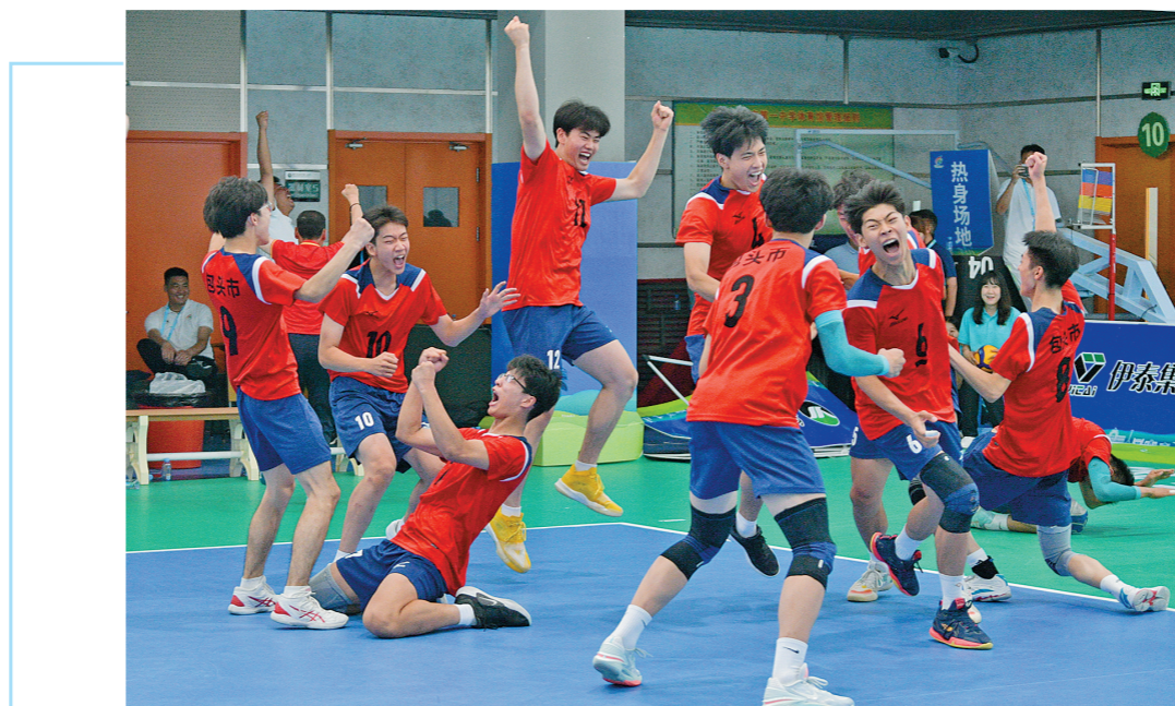
排球项目男子甲组决赛中,包头市代表队的夺冠时刻。