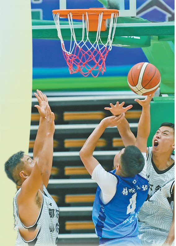
群众组篮球决赛上演精彩对攻战。