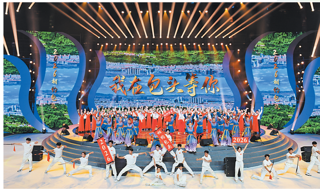
内蒙古自治区第十五届运动会圆满落幕。