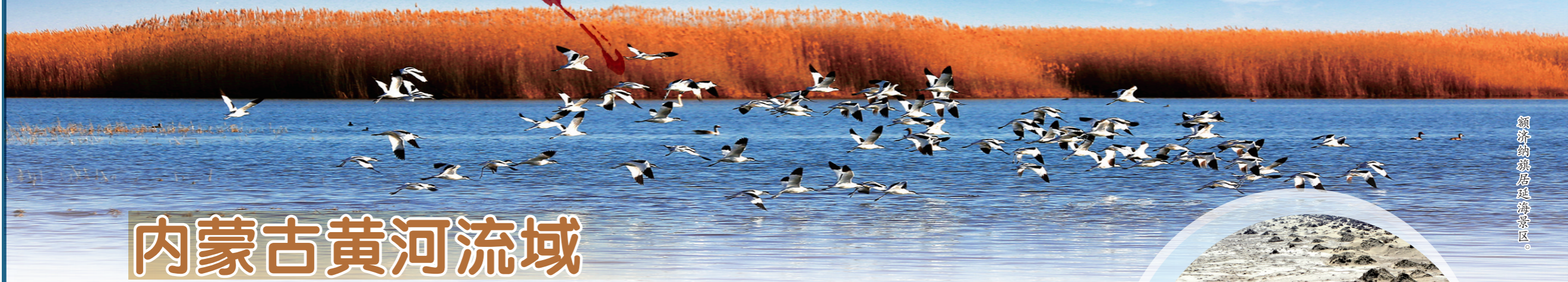
额济纳旗居延泽景区。

居延遗址、曼德拉山岩画神秘且闻名世界;古丝绸之路之上现存最完整、规模最宏大的黑城遗址展示着这里曾经的灿烂与辉煌;担负着运盐通道重要使命的驼盐古道,不仅带来了长达几百年经济贸易的繁盛,也留下了各民族交往交流交融的生动史料。