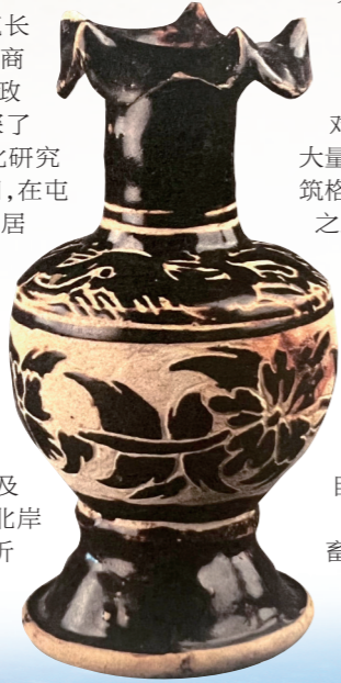
西夏褐釉剔划莲花口瓷瓶。

兴起的丝绸之路,将居延地区作为重要的中转地。经过河西走廊的绿洲丝绸之路,其中一条线路就是从甘肃向北经居延地区中转,再从居延向北进发;还有一条草原丝绸之路,在漠南地区呈东西走向延伸,从东部地区的辽中京城、上京城以及元代的大都、上都城向西,经过集宁、黄河北岸的河套地区,再向西进入居延地区,然后折向北。居延地区是穿过戈壁便捷的交通节点,过往的行人、商队可在此备齐补给,再向戈壁进发,然后再走向中亚、欧洲。