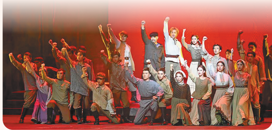
图为话剧《钢铁是怎样炼成的》剧照。

在阶级压迫极为残酷的时代，穷人，活得非常艰难。舞台上出现了一个不算豪华的大餐厅。一个女招待正追着“领班”要钱：“你答应是300卢布，怎么只给我50？”领班在百般刁难后，又掏出20卢布，却要女招待以身体为代价。见此情状，少年保尔气愤不已，上前与领班争辩，却被踢下楼梯，并丢了差事。当他回到家向妈妈哭诉此事时，“相信上帝！相信上帝！”妈妈说，“相信上帝！”保尔说。可是，上帝真的能拯救穷人？此前，保尔不就是被教会学校开