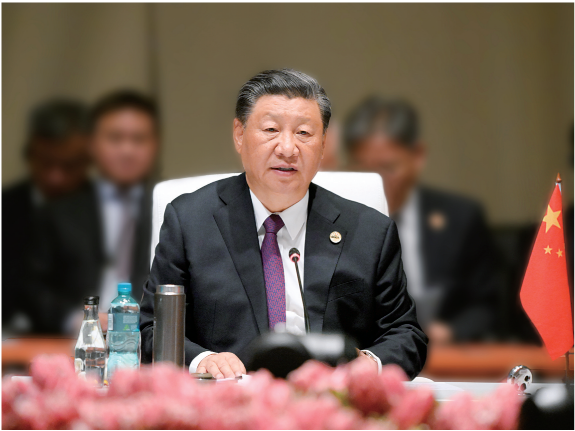
当地时间8月23日上午,金砖国家领导人第十五次会晤在约翰内斯堡杉藤会议中心举行。南非总统拉马福萨主持会晤。中国国家主席习近平、巴西总统卢拉、印度总理莫迪和俄罗斯总统普京(线上)出席。习近平发表题为《团结协作谋发展 勇于担当促和平》的重要讲话。