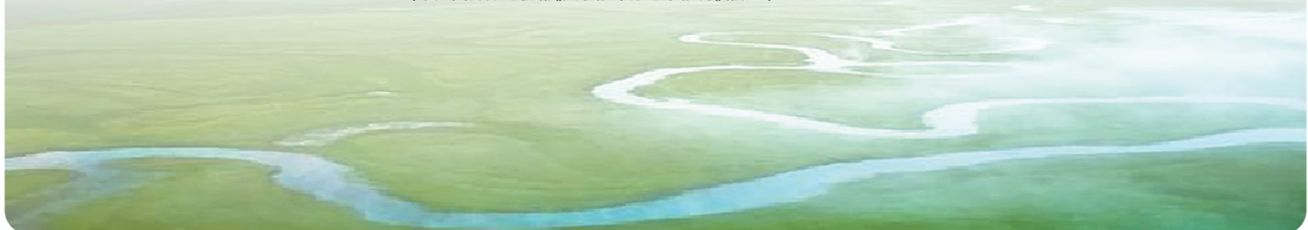
(本文图片为电视剧《父亲的草原母亲的河》剧照。)