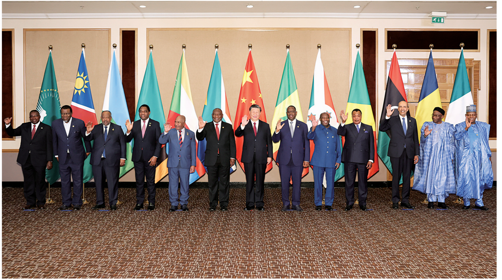
当地时间8月24日晚，国家主席习近平和南非总统拉马福萨在约翰内斯堡共同主持中非领导人对话会。 习近平发表题为《携手推进现代化事业 共创中非美好未来》的主旨讲话。