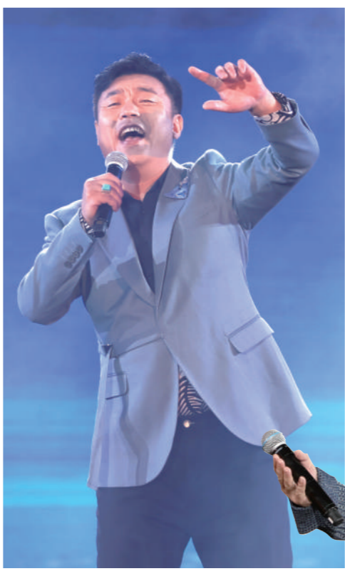
科尔沁夫演唱《画你》。