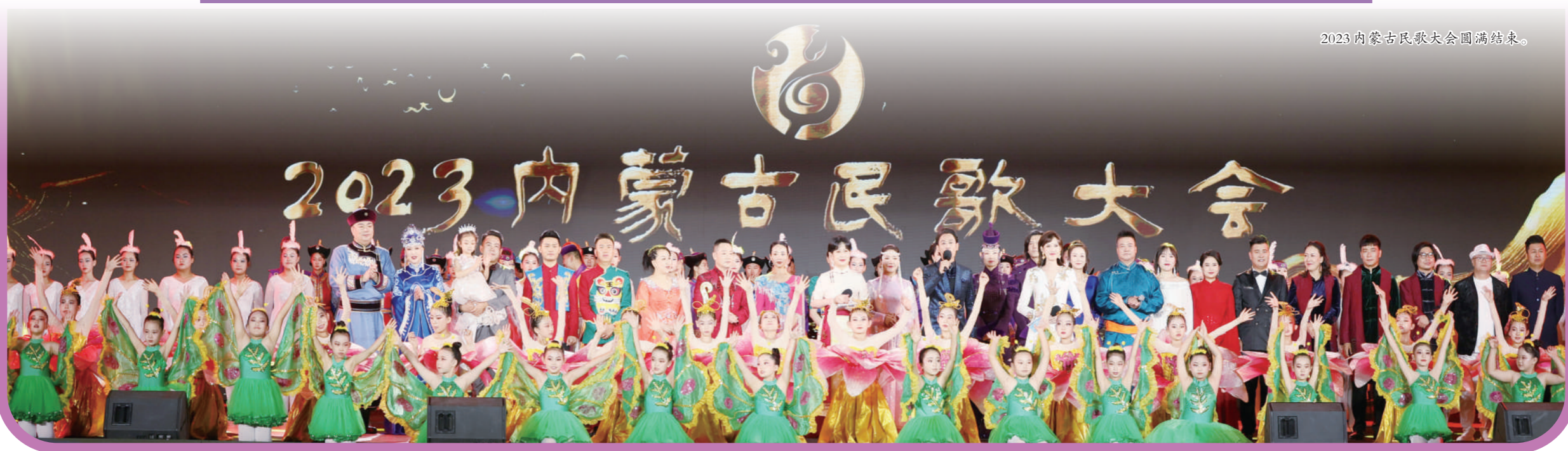
2023 内蒙古民歌大会圆满落幕。