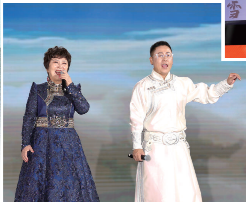
金花母子演唱《北京的金山上》。