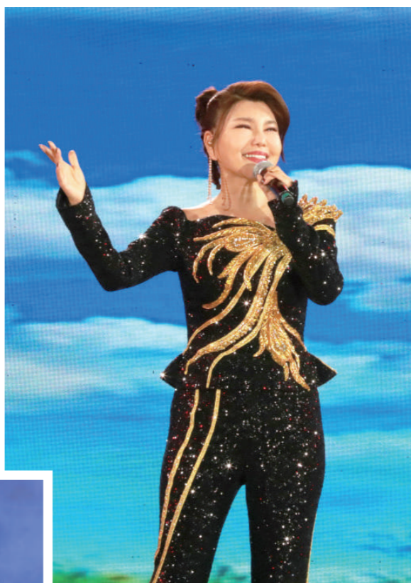
乌兰图雅演唱《天边的天籁》。