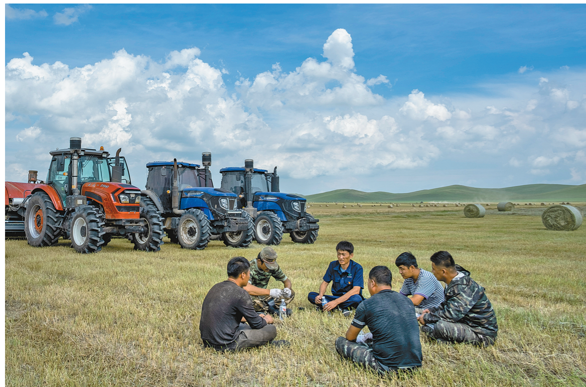
商讨任务分配,确保稳产丰收。