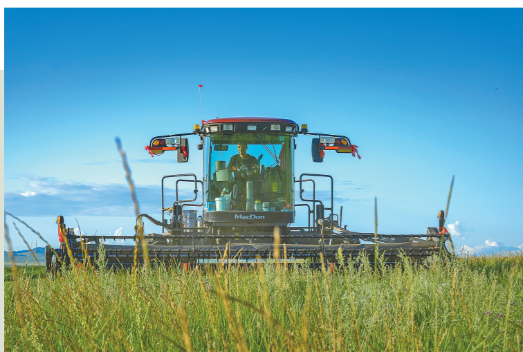
大型农业机械收割作业。