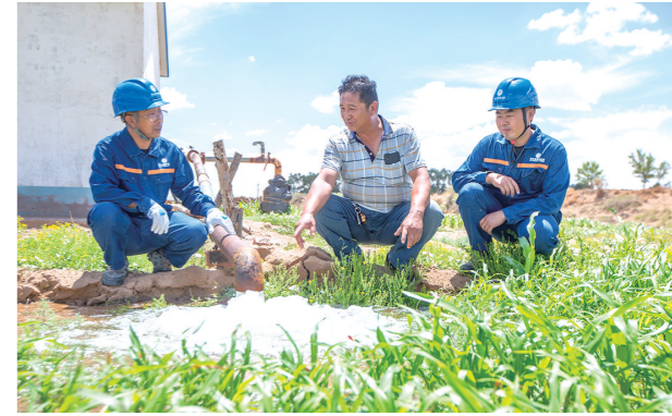
内蒙古电力集团鄂尔多斯供电公司共产党员走进田间地头,为农牧民灌溉用电提供稳定电力保障。