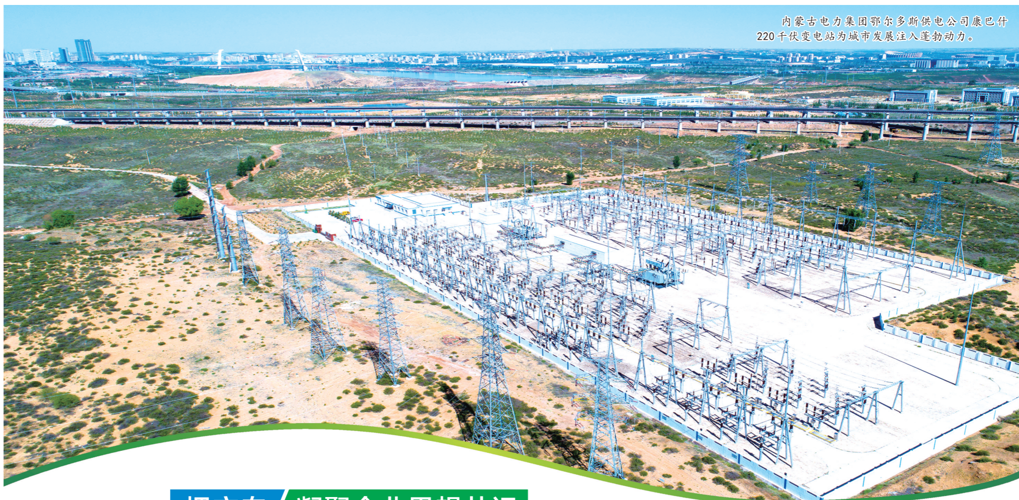
内蒙古电力集团鄂尔多斯供电公司康巴什220千伏变电站为城市发展注入蓬勃动力。