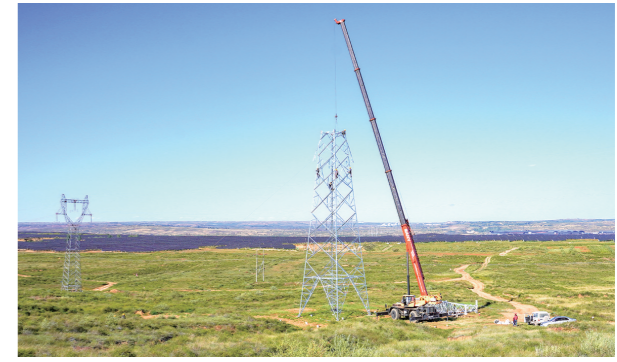
内蒙古电力集团鄂尔多斯供电公司伊金霍洛旗复垦区光伏治理项目并网建设配套电力线路。