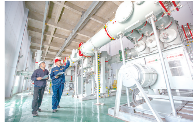
内蒙古电力集团鄂尔多斯供电公司共产党员依托自治区首家园区电力服务站,深入隆基绿能科技公司开展现场服务。

如今,党建引领已经成为鄂尔多斯供电公司重要战略落地和企业蓬勃发展的根本保障,公司治理体系和治理能力现代化水平实现稳步提升。