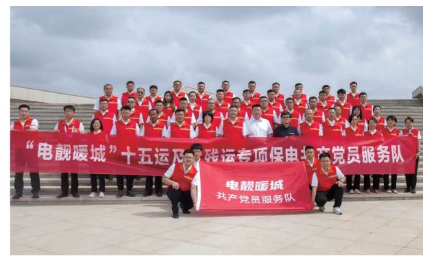
内蒙古电力集团鄂尔多斯供电公司组建“电靓暖城”共产党员服务队,圆满完成了自治区十五运及六线运重大保电任务。

五年来,公司党委常态化制度化推进“两学一做”学习教育、“不忘初心、牢记使命”主题教育、党史学习教育,高标准开展学习贯彻习近平新时代中国特色社会主义思想主题教育,通过专题党课、主题党日、视频展播等形式,依托两级学习讲堂、讲习团提升理论学习的质效,获评“学习强国”全区优秀管理组,连续三年获评内蒙古电力集团年度“中心组学习示范讲堂”,讲习团获评内蒙古电力集团、鄂尔多斯市首届“优秀新时代讲习团”,10余篇中心组成员理论文章获得自治区及以上奖项。持续强化思想引领,严格落实意识形态工作责任制,对外全媒体讲好企业故事,对内不断强化典型引领,相关报道累计浏览量超过2800万次。开展“五爱五家”幸福企业建设,深入实施“青马工程”和青春建功行动,激发了广大职工立足岗位建功立业的热情。