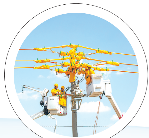
内蒙古电力集团鄂尔多斯供电公司持续推广带电作业,实现电力检修客户“零感知”,让群众享受“清凉一夏”。