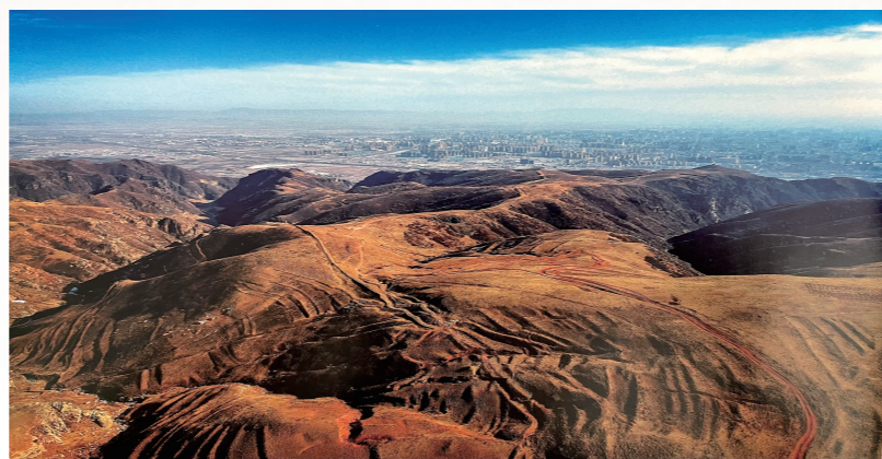
▲呼和浩特市坡根底秦长城。

蜿蜒于巴彦淖尔阴山山脉地带的秦汉长城遗迹应属秦万里长城的中间段落,其中小会套秦长城西至乌拉特中旗德岭山,东与包头市固阳秦长城相接。据考古专家鉴定,此为秦长城保存最为完整的段落。