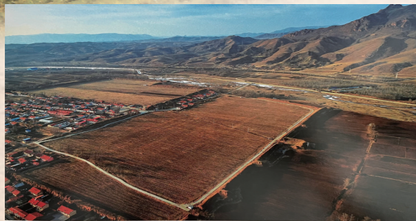
▲乌兰察布市卓资县梨花镇汉代三道营古城。