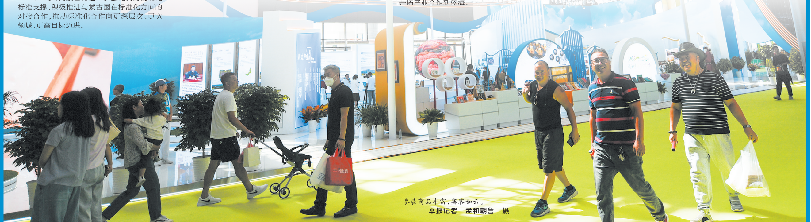
参展商品丰富,宾客如云。