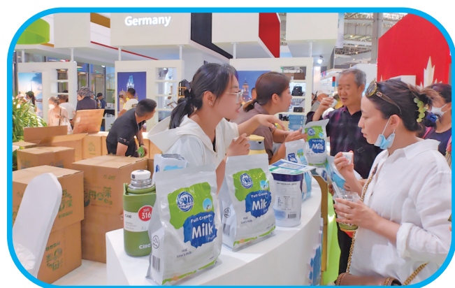
国际馆内人气爆棚。

下一步,内蒙古将进一步强化贸易便利化标准支撑,积极推进与蒙古国在标准化方面的对接合作,推动标准化合作向更深层次、更宽领域、更高目标迈进。