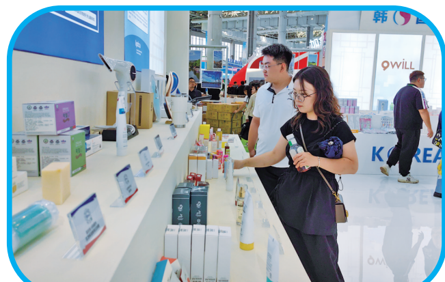
消费者在挑选化妆品。