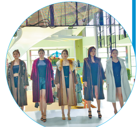
貂皮大衣时装走秀。

“中国愿同蒙古国一道,落实好两国元首重要共识,深化双方政治互信与互利合作,丰富中蒙全面战略伙伴关系内涵,加快构建两国命运共同体,更好造福两国人民。”蒙古国政府将重点加强旅游业、农牧业、可再生能源等领域发展,完善这些领域法律和政策,欢迎中方前来投资兴业。”“内蒙古与广东一直在各领域保持着密切的合作。今年以来,内蒙古和广东共同组织了2023粤蒙‘百万人互游’活动,在生物芯片、区块链等领域共同开展科技创新,还召开了2023粤蒙数字经济大会,不断深化教育和科技领域人才合作。”“甘蒙两省区在筑牢国家生态安全屏障方面肩负着重要的历史使命,希望双方在统筹山水林田湖草沙综合治理、深入推进矿产资源勘查开发等方面加强合作,共同为构建高质量发展新格局谱写甘蒙合作新篇章。”……以第四届中蒙博览会为桥梁,各方正满怀信心,共谋发展、共话未来,奋力开拓产业合作新蓝海。