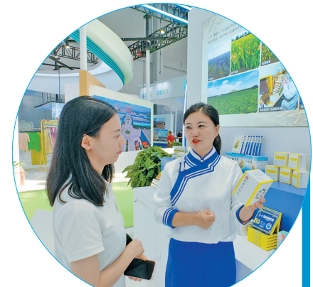
中(蒙)医药很吸睛。