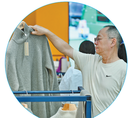
蒙古国羊绒制品受青睐。