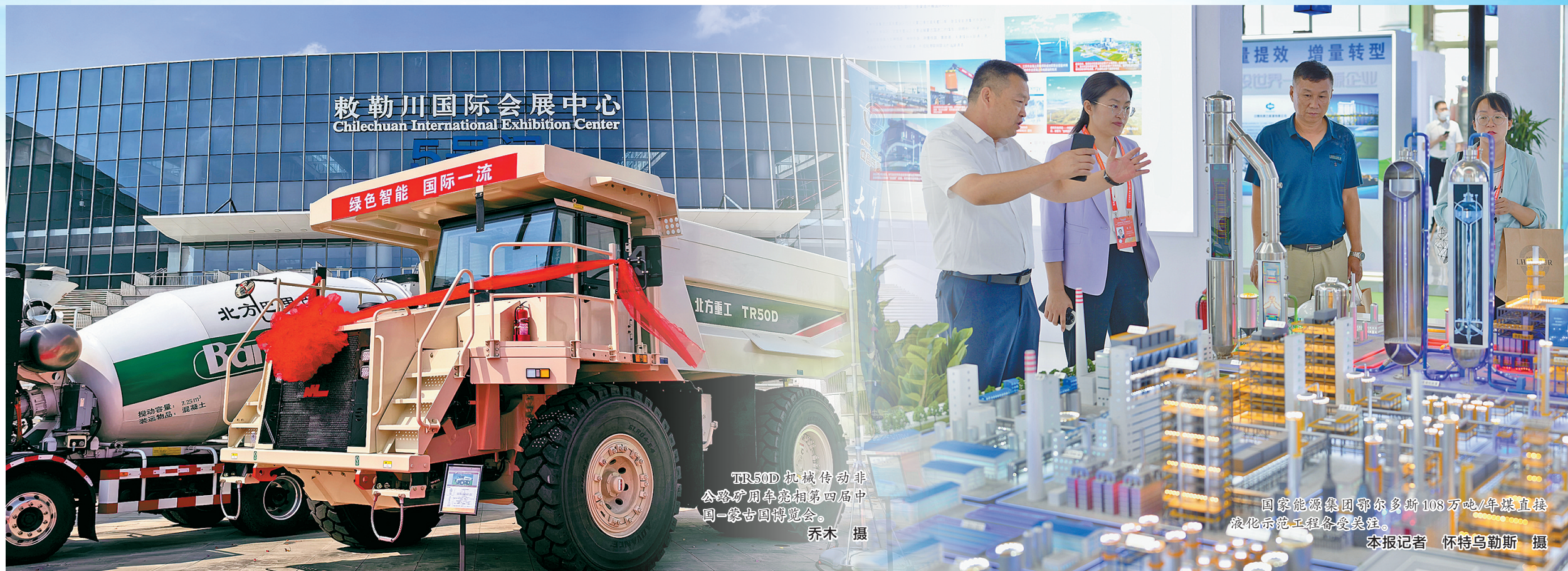
敕勒川国际会展中心 Chilechuan International Exhibition Center