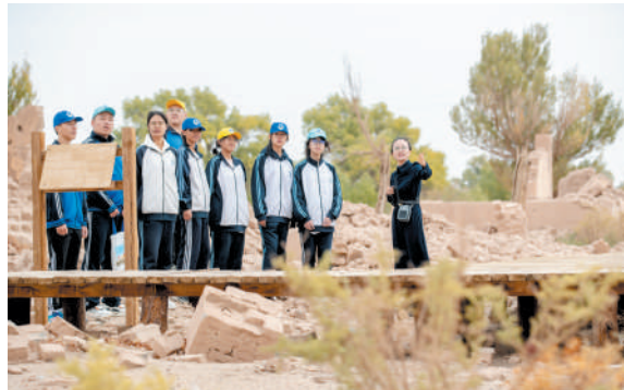
参观额济纳旗党政机关旧址——宝日乌拉。