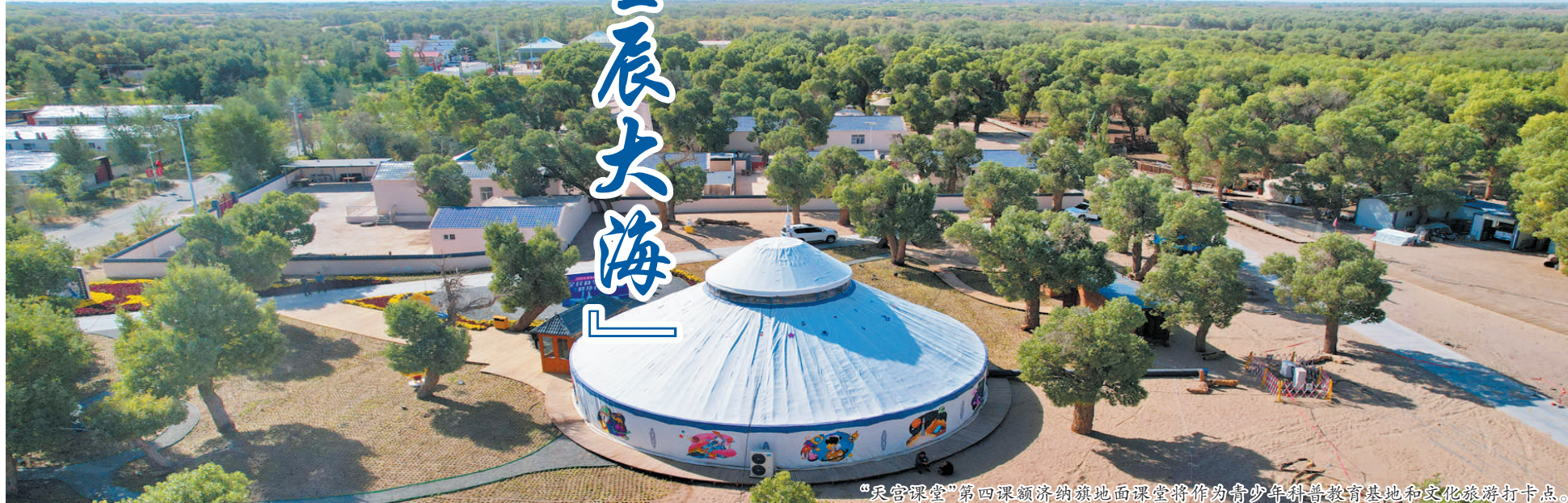
“天宫课堂”第四课额济纳旗地面课堂将作为青少年科普教育基地和文化旅游打卡点。