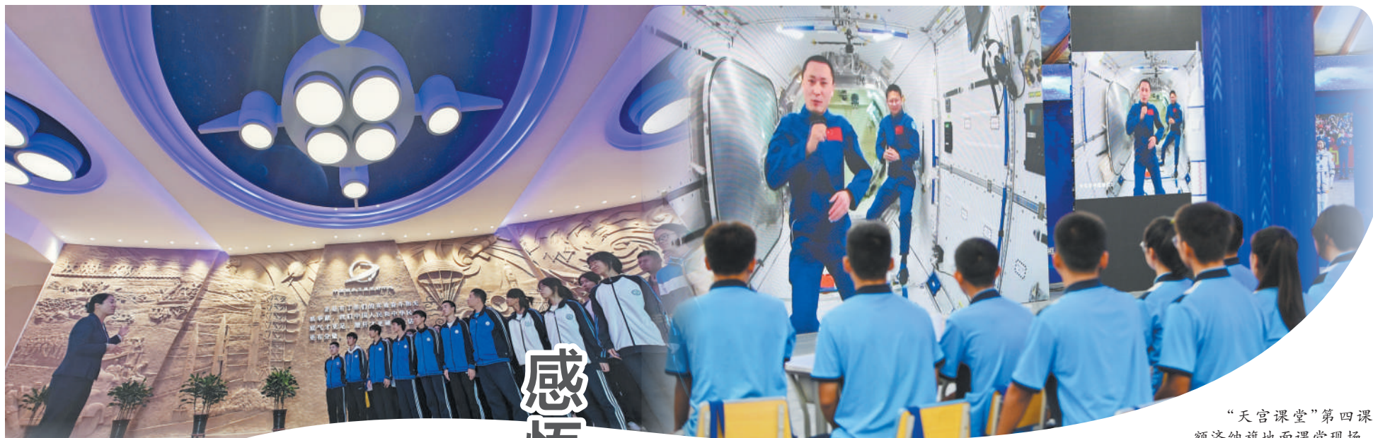
参观中国酒泉卫星发射中心历史展览馆。