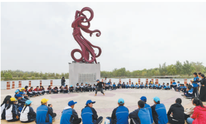
在中国酒泉卫星发射中心飞天公园,来自阿拉善盟各地的师生围坐在一起表演才艺,交流了解、增进友谊。

在中国酒泉卫星发射中心历史展览馆,一件件实物、一幅幅照片、一行行文字、一个个场景还原……生动记录着中国航天事业发展的宏伟历程和辉煌成就。师生们徜徉在展厅里,在与讲解员的互动交流中,探索学习航天知识,了解一代代航天人接续奋斗、不懈追求“航天梦”的感人事迹,感悟深厚博大的航天精神。 庄严肃穆的东风革命烈士陵园内,长眠着760多位为祖国航天事业和国防科技事业献出生命的英烈。站在巍然耸立的东风革命烈士纪念碑下,师生们敬献花篮、鞠躬默哀,缅怀先烈、寄托哀思。