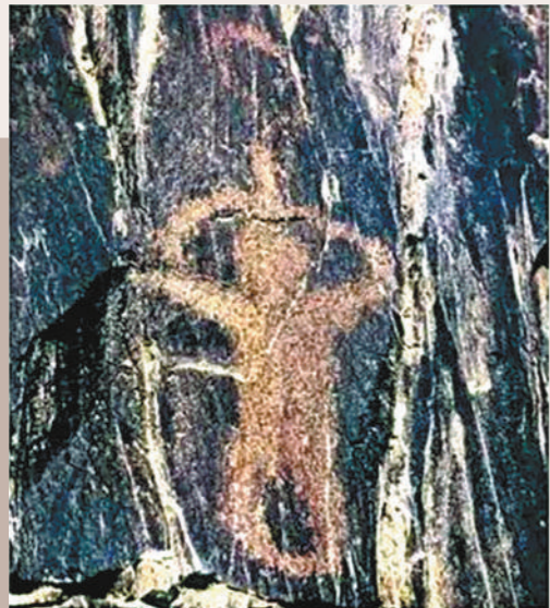
阴山岩画《拜日月图》。

往前溯源,远古之时,就兴盛拜月,这源于原始先民对月亮的自然崇拜和神化。他们将月亮的神崇拜镌刻在岩石上、描绘在陶器上、浇筑在青铜器上。这些形式多样、丰富多彩的拜月文物遗存,让后人看到了中华文化的博大精深,源远流长,一脉相承。