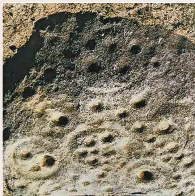
阴山岩画《日月星宿图》。