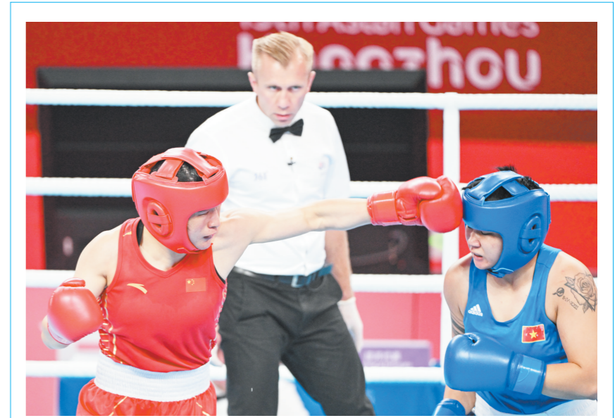
内蒙古运动员李倩晋级亚运会拳击决赛

下一步,自治区医保局将指导医疗机构完善内部管理,严格遵守明码标价、日费用清单等制度,公开价格信息,增加收费透明度,对不按规定调整价格的违法行为将严肃查处。