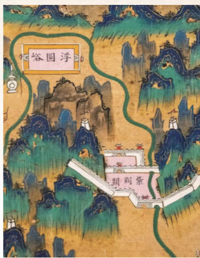
▲国家博物馆馆藏明代《九边图》屏（局部）。▲明大边东沟敌台。