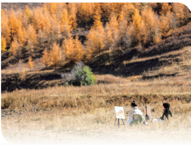
呼和浩特市大青山秋色迷人,吸引游人写生。