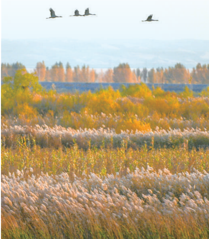
候鸟在包头国家湿地公园飞舞。

金色的草原、五彩的林海、深蓝的湖水……深秋的内蒙古宛若打翻了七彩调色盘,大地色彩斑斓,农民喜获丰收。这个秋天,在祖国北疆,感触这场秋日盛宴。