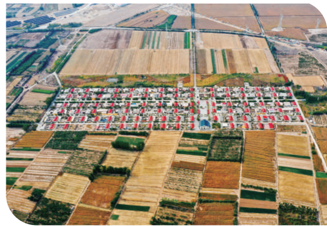
乌海市阳光天宇农业综合体周边农田五彩斑斓。