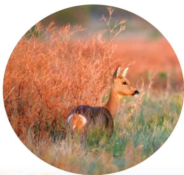
狍子在锡林郭勒盟西乌珠穆沁旗吉日格斯台国家级自然保护区栖息。