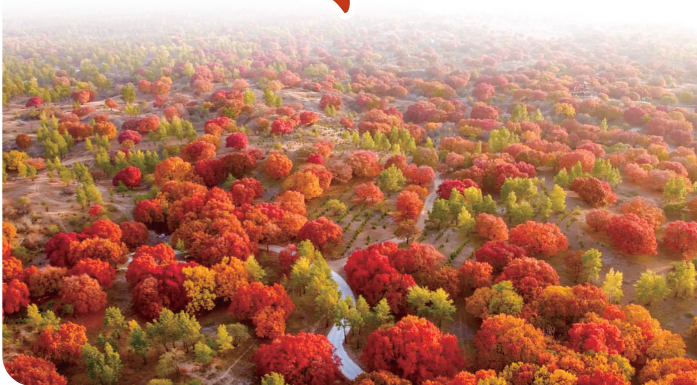
通辽市科左后旗35万亩原生态枫林换“红妆”。