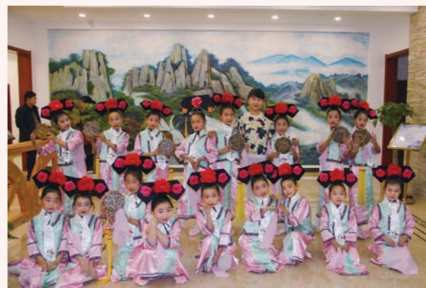
呼和浩特市毫沁营小学的学生在吉林市演出八角鼓舞蹈《满族情韵》。