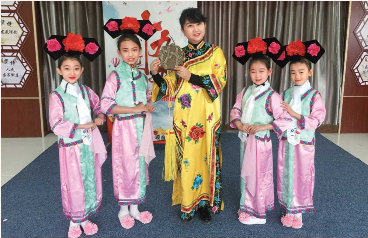
八角鼓进社区大型公益演出现场。

八角鼓至今已有百年历史,在百年传承中,八角鼓在一代代艺人的努力下,从历史走进现代,在中华文化百花园中绽放着绚丽多姿的迷人色彩。