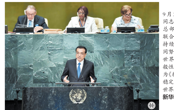
图⑪:2016年9月21日,李克强同志在纽约联合国总部出席第71届联合国大会以“可持续发展目标:共同努力改造我们的世界”为主题的一般性辩论并发表题为《携手建设和平稳定可持续发展的世界》的讲话。