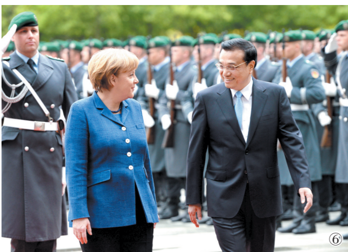
图⑥:2013年5月26日,李克强同志在柏林出席德国总理默克尔举行的欢迎仪式。