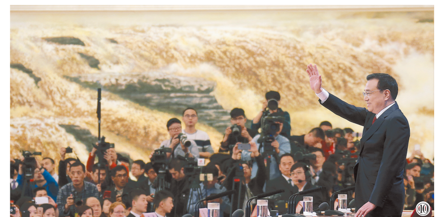
图⑩:2016年3月16日,李克强同志在北京人民大会堂与中外记者见面,并回答记者提问。