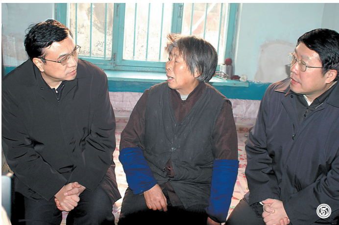
图⑤:2004年12月26日,李克强同志到宁夏回族自治区银川市西夏区居民王淑区家中走访慰问。