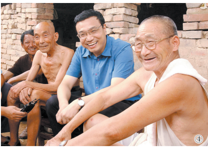
图④:2003年8月8日,李克强同志在河南省新乡市调研。这是李克强同志在原阳县桥北乡马庄村与村民亲切交谈。