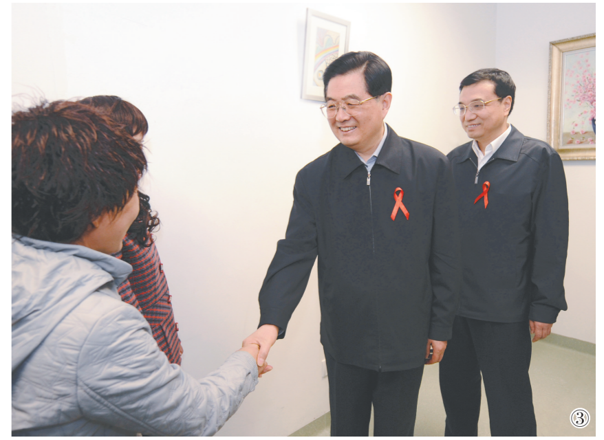
图③:2008年12月1日是第21个世界艾滋病日。胡锦涛同志和李克强同志来到北京地坛医院考察艾滋病防治工作。