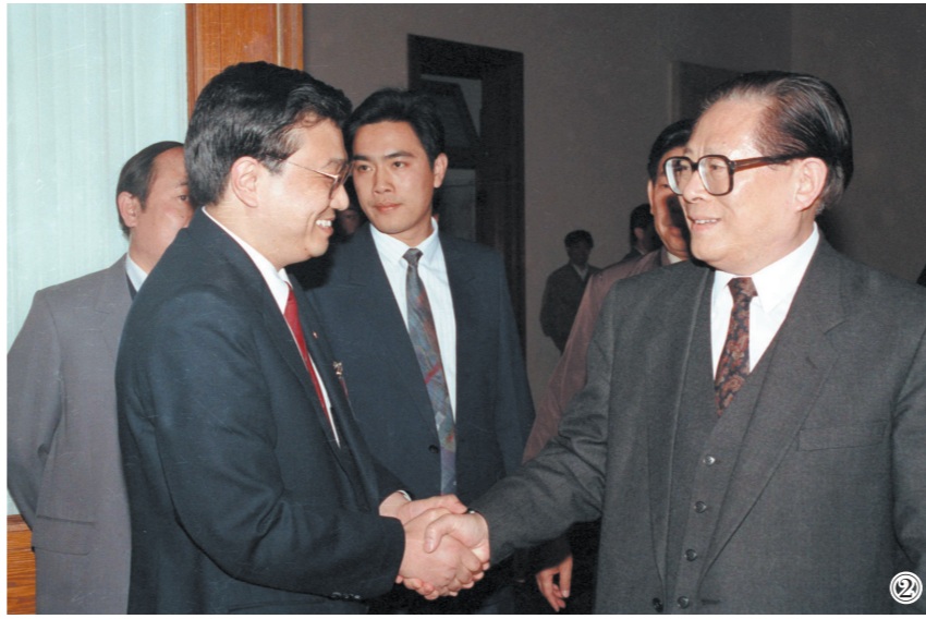
图②:1993年5月3日下午,中国共产主义青年团第十三次全国代表大会在北京人民大会堂开幕。在5月3日上午的预备会议后,举行第一次主席团会议,推选李克强等同志为主席团常务主席。这是江泽民同志与李克强同志握手。