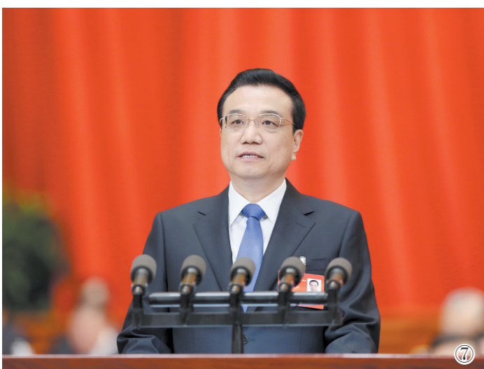
图⑦:2014年3月5日,第十二届全国人民代表大会第二次会议在北京人民大会堂开幕。李克强同志作政府工作报告。