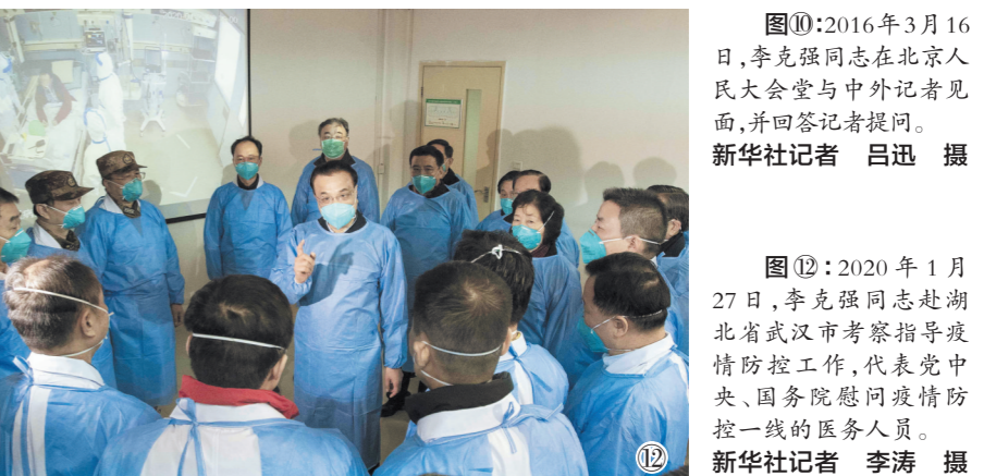
图⑫:2020年1月27日,李克强同志赴湖北省武汉市考察指导疫情防控工作,代表党中央、国务院慰问疫情防控一线的医务人员。