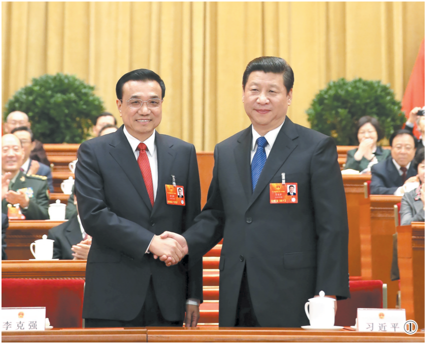
图①:2013年3月15日,第十二届全国人民代表大会第一次会议在北京人民大会堂举行第五次全体会议。会议经过投票表决,决定李克强为中华人民共和国国务院总理。这是习近平同志和李克强同志亲切握手。