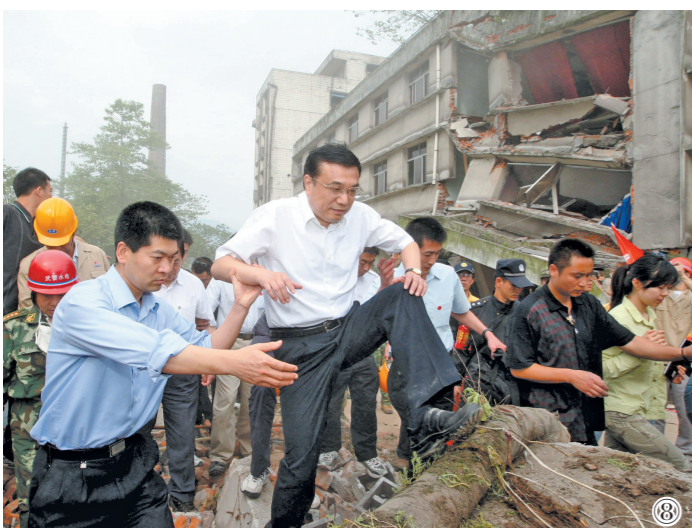
图⑧:2008年5月19日,李克强同志在四川地震灾区察看灾情。